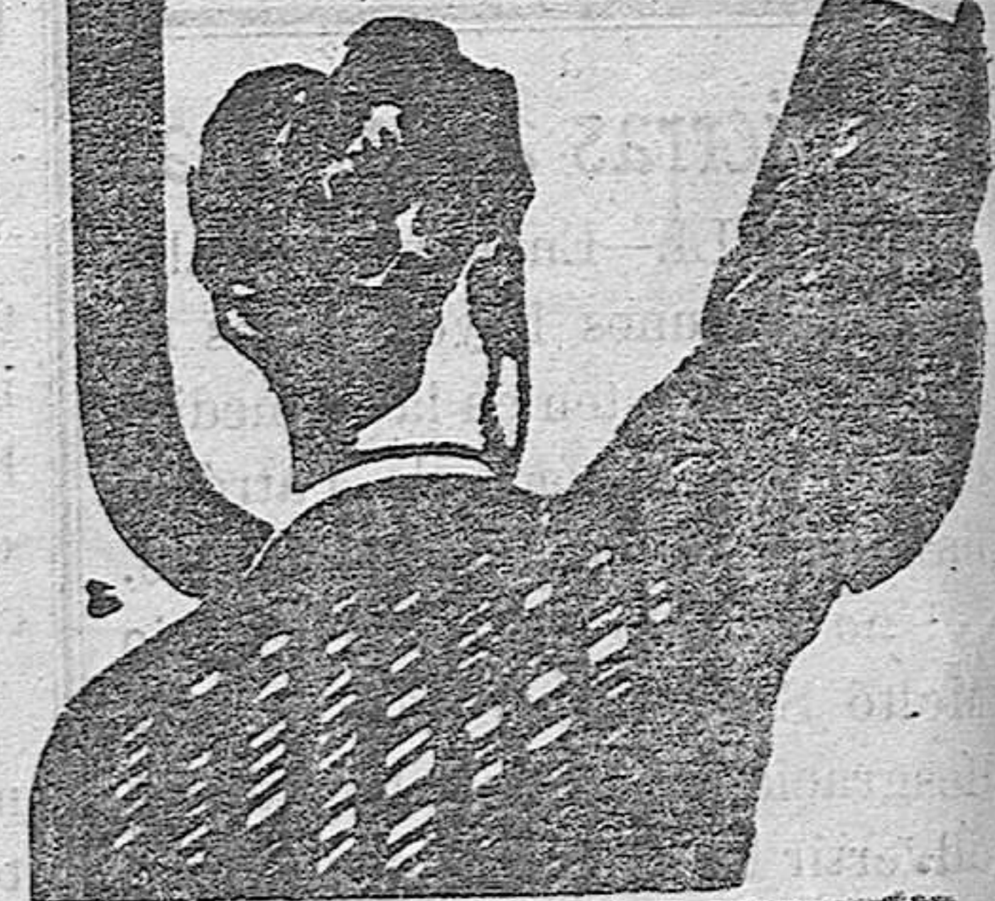
COMPRAR EN FARMACIAS Y HERBERIAS

Los Médicos le llaman el REMEDIO DE LOS DÉBILES