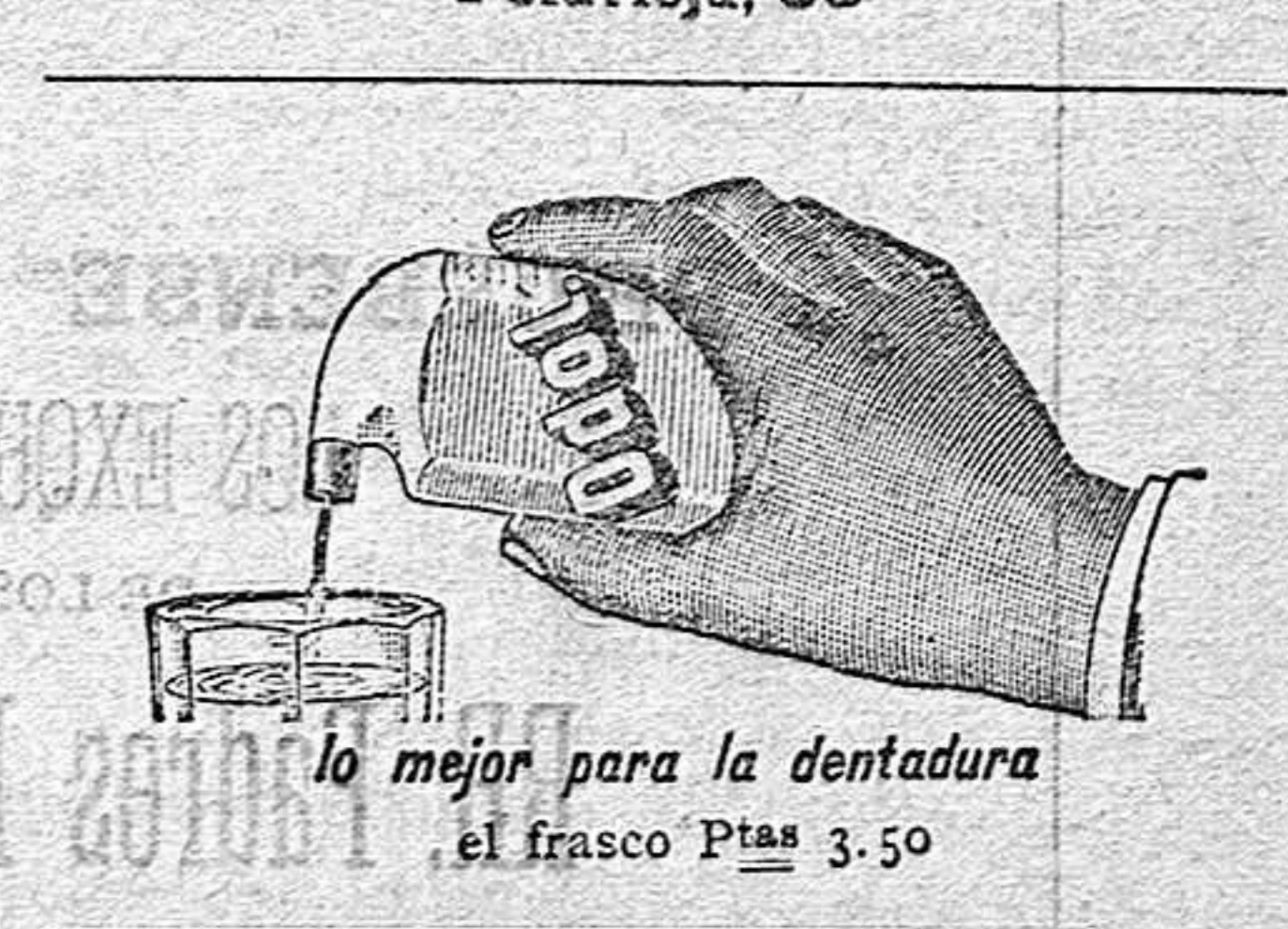
Tran. del HERALDO DE ALCOY