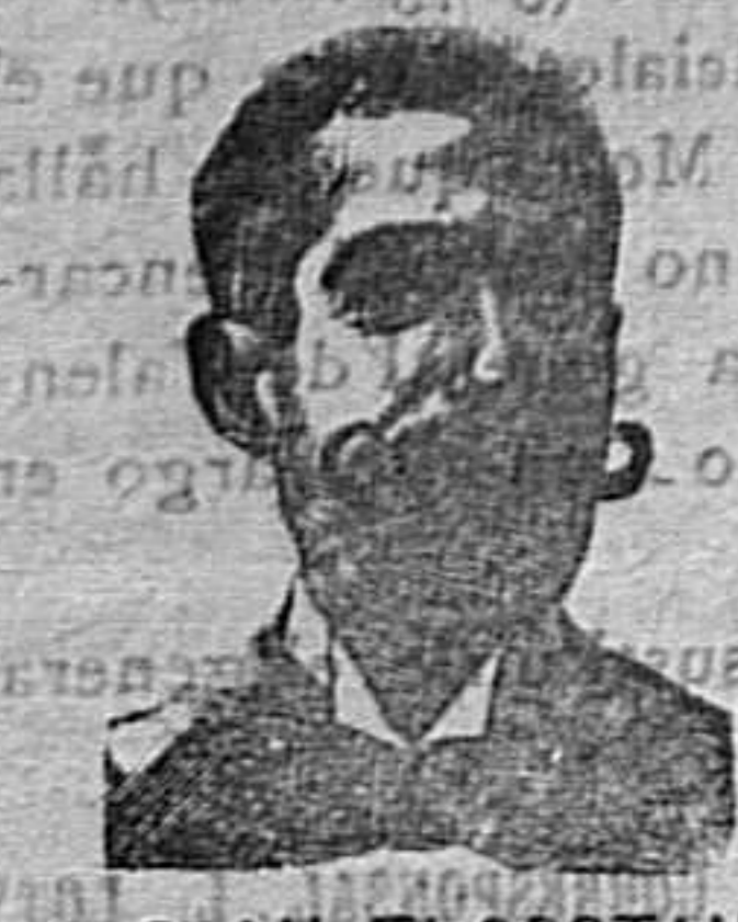
A. SALVATI COSTANZI

CONFITES ANTIVENEREOS Y ROOB ANTISIFILITICOS COSTANZI