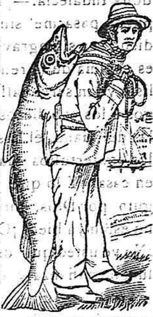
MARCA DE FABRICA