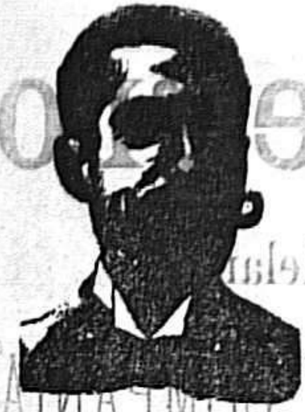
A. SALVATI COSTANZI Calle Diputación, 435.-Barcelona