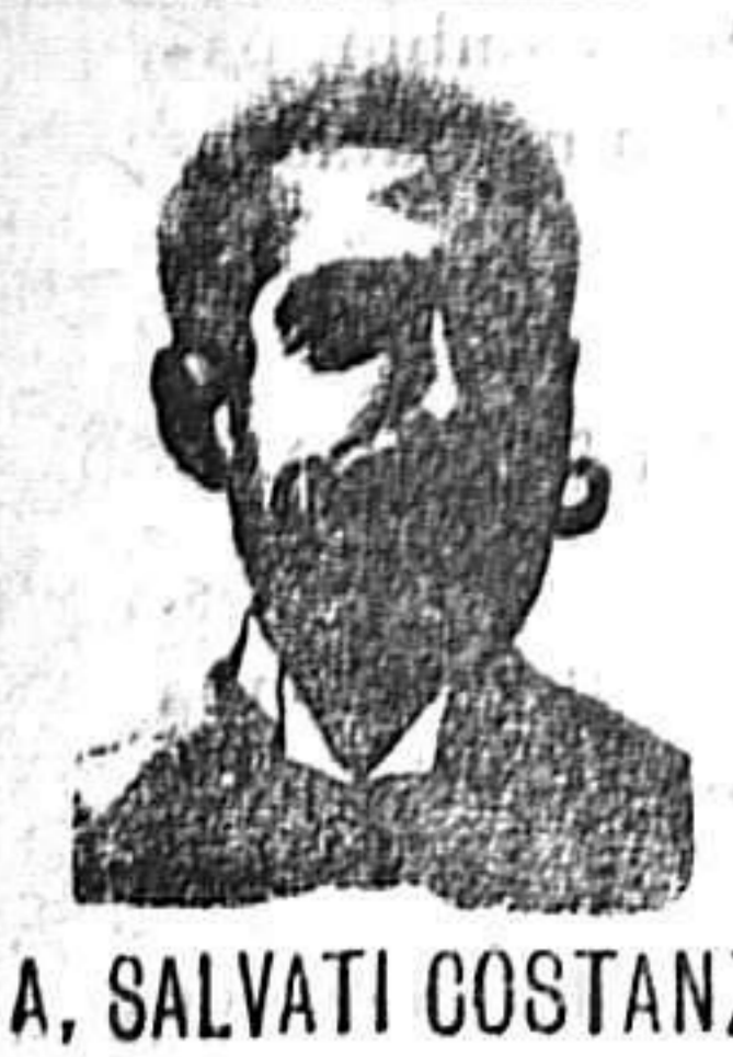
A. SALVATI COSTANZI Calle Diputación, 435 - Barcelona