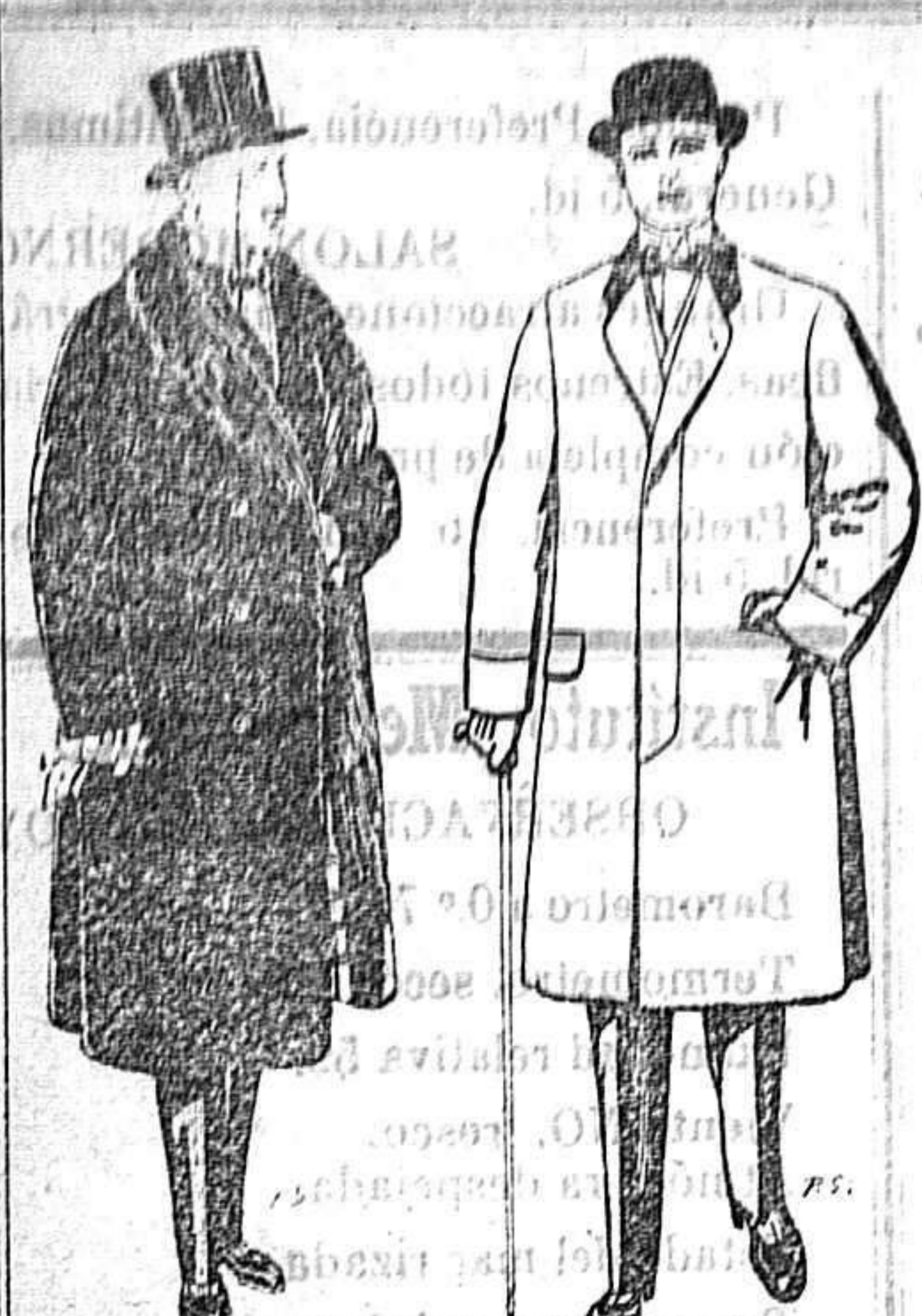
Gabanes de edredón negro forro seda cuello y vistas de piel. A 125 y 135 ptas.