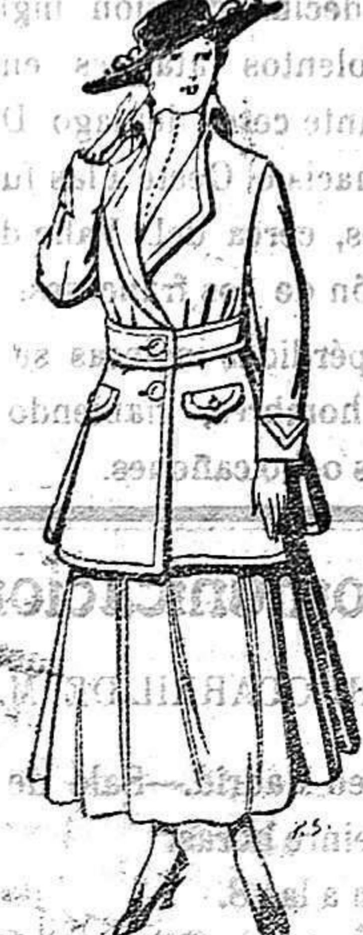
Abrigos de patén gran novedad para señora. De 26 a 40 ptas.