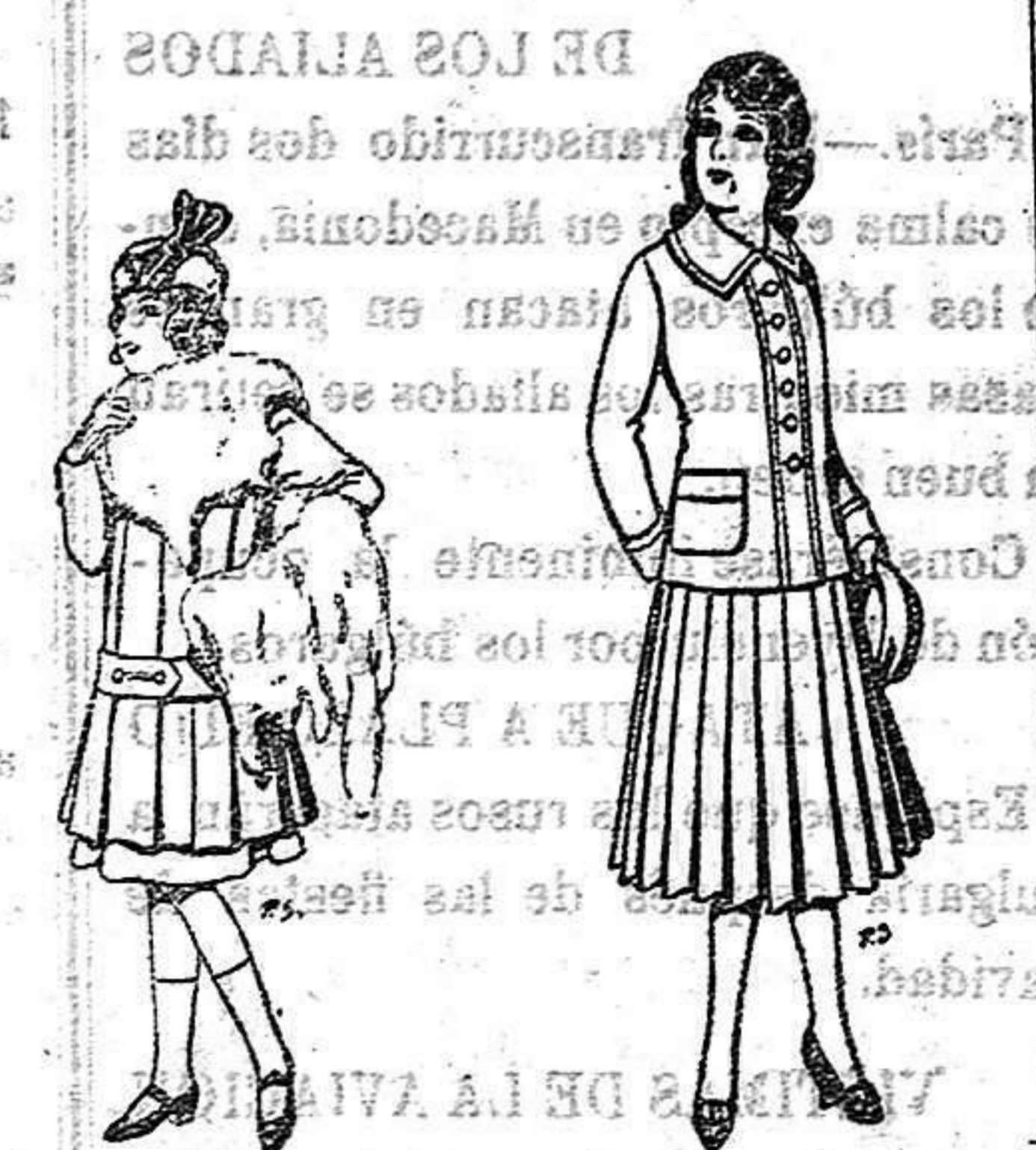
Juego de pieles para niñas. A 15 ptas.