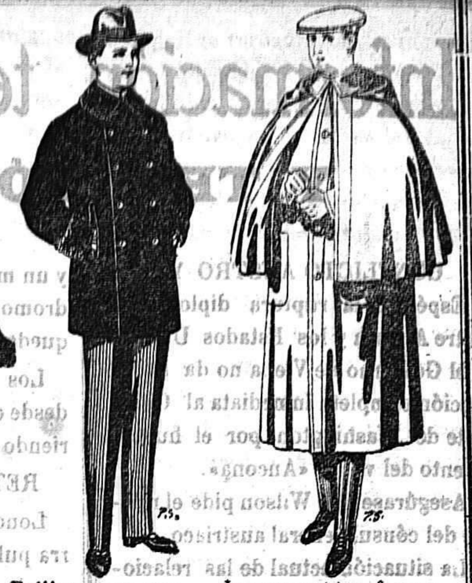
Pellizas con cuello y bocamangas astracán. De 14 a 90 ptas.

Peletería, Camisería, Géneros de Punto, Corbatería, Guantería, Sombrerería, Zapatería, Paraguas, Bastones y Artículos de Viaje.