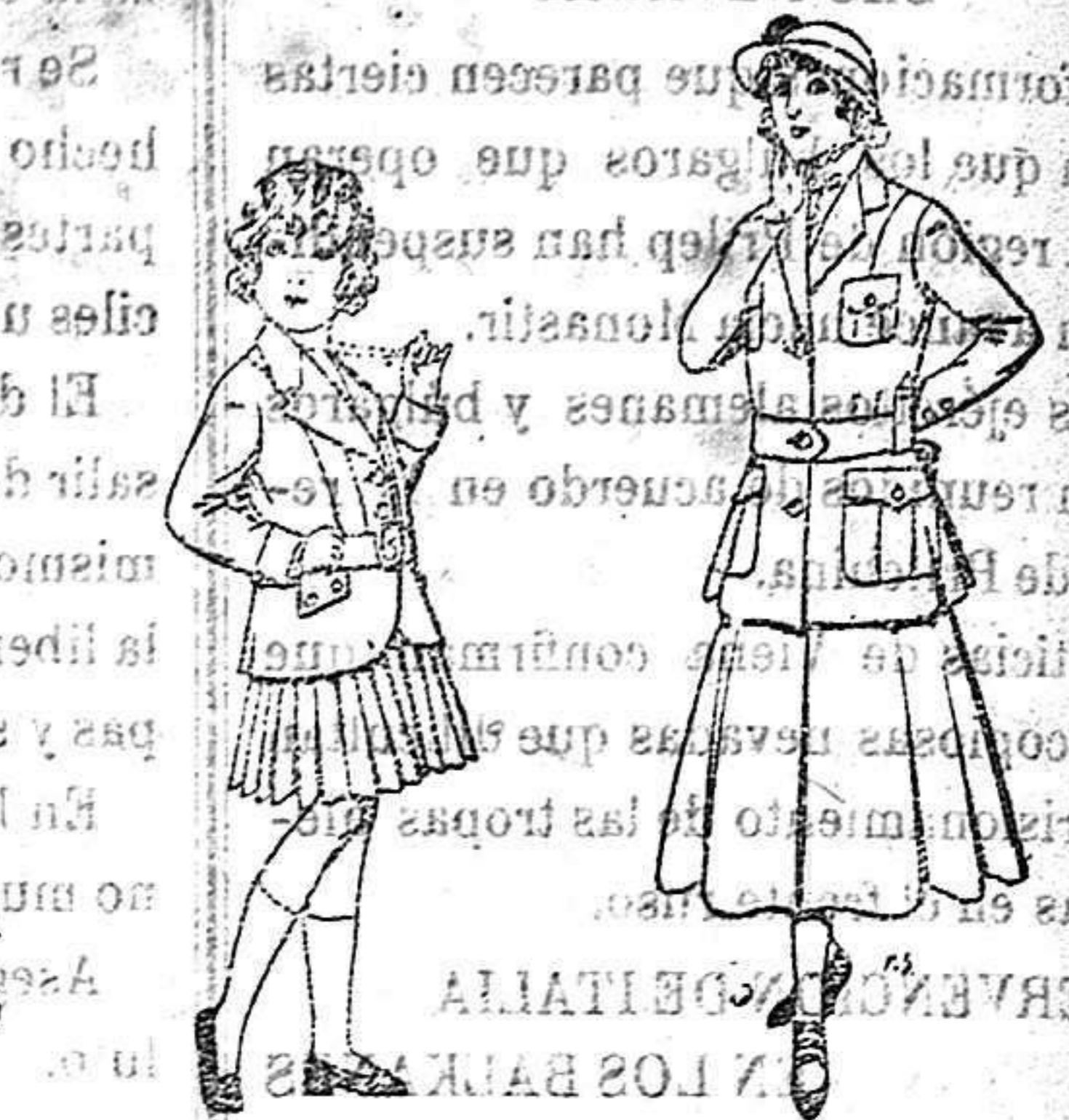
Trajes de familia / para niñas de 4 a 11 años / De 20 a 35 ptas. / Trajes de lana / para jovencitas / de 13 a 16 años / De 40 a 45 ptas.

PRECIO FIJO -- VENTAS AL CONTADO -- PÍDASE EL CÁTALOGO GENERAL