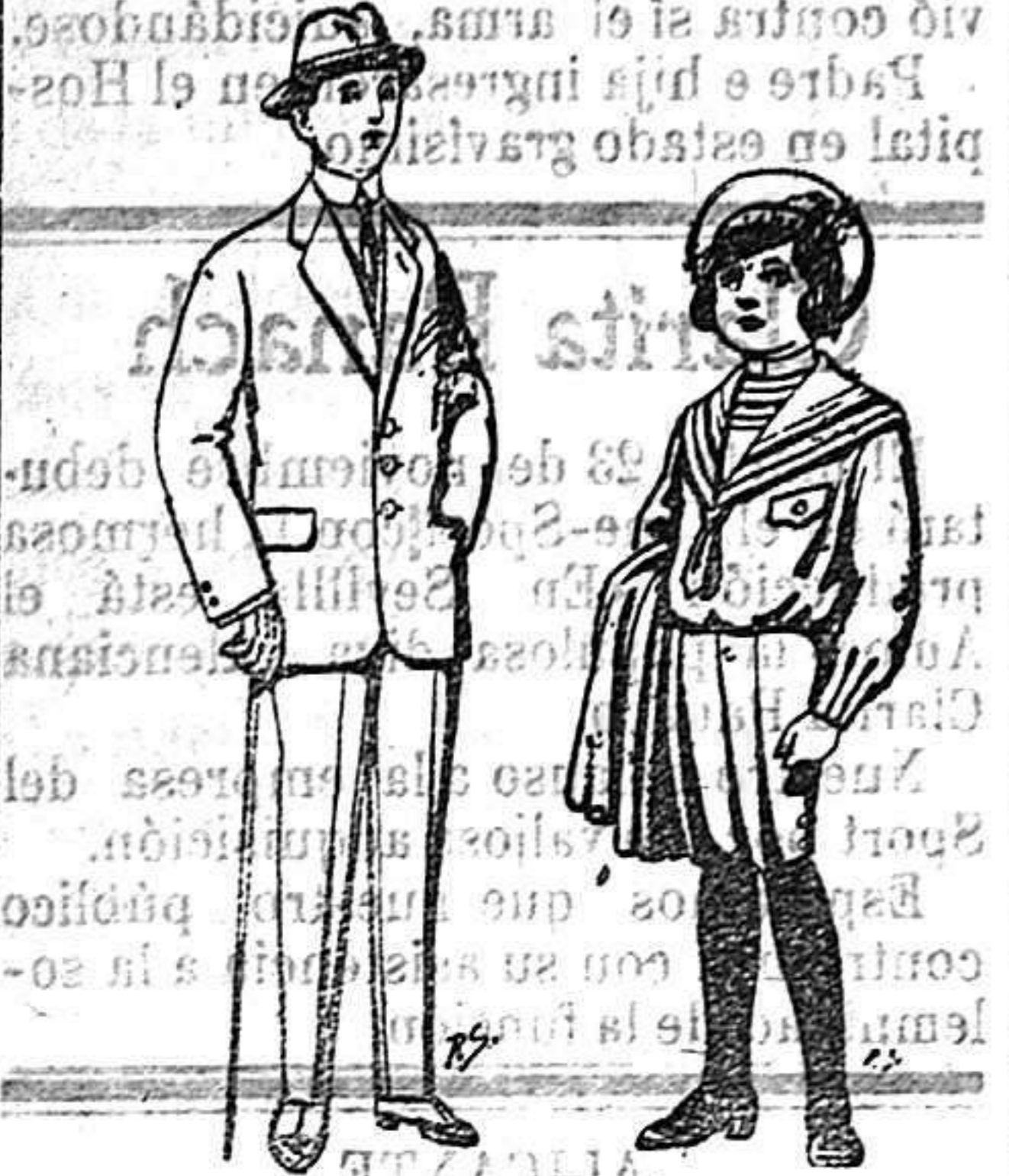
Trajes de pátén, vi- / Trajes de jerga / De 14 a 50 ptas. / De 5 a 10 ptas.