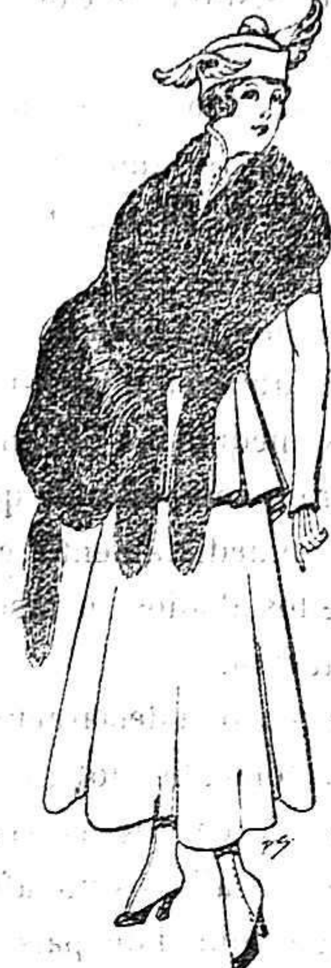
Juego de pieles imitación perfecta al renard negro. De 40 a 45 ptas