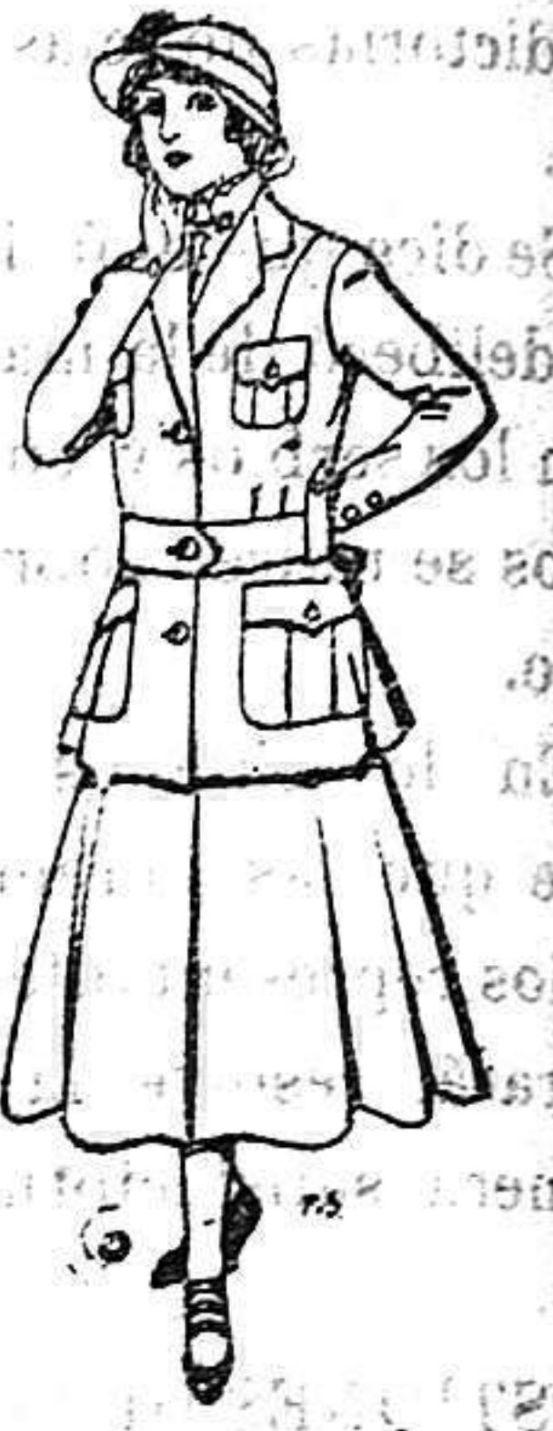
Trajes de lana para jovencitas de 13 a 16 años. De 40 a 45 ptas.