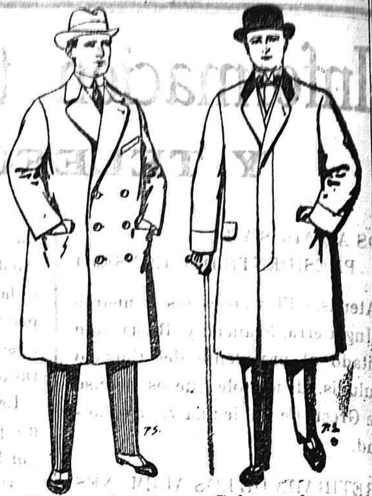
Gabanes de paten cheviot etc. De 55 a 105 ptas. Gabanes de paten melton o cheviot. De 25 a 100 ptas.