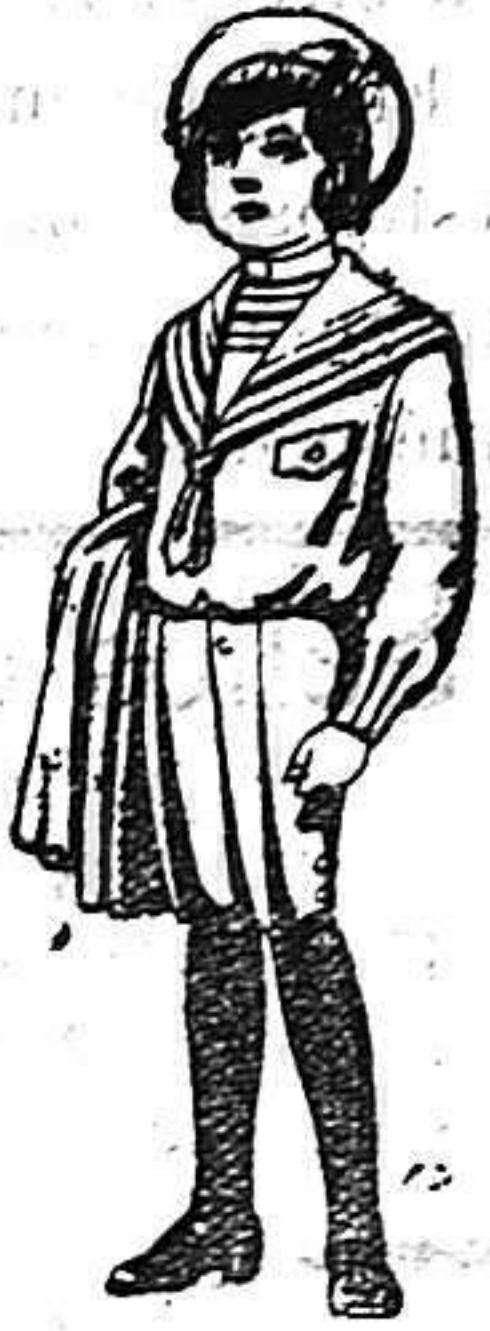
Trajes de jerga negra o azul para niños de 4 a 9 años. De 5 a 10 ptas