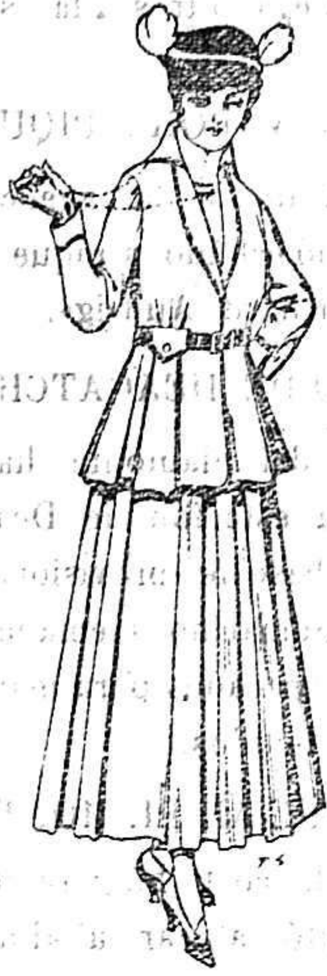
Trajes de lana negra, azul y color para señora. A 85 ptas.