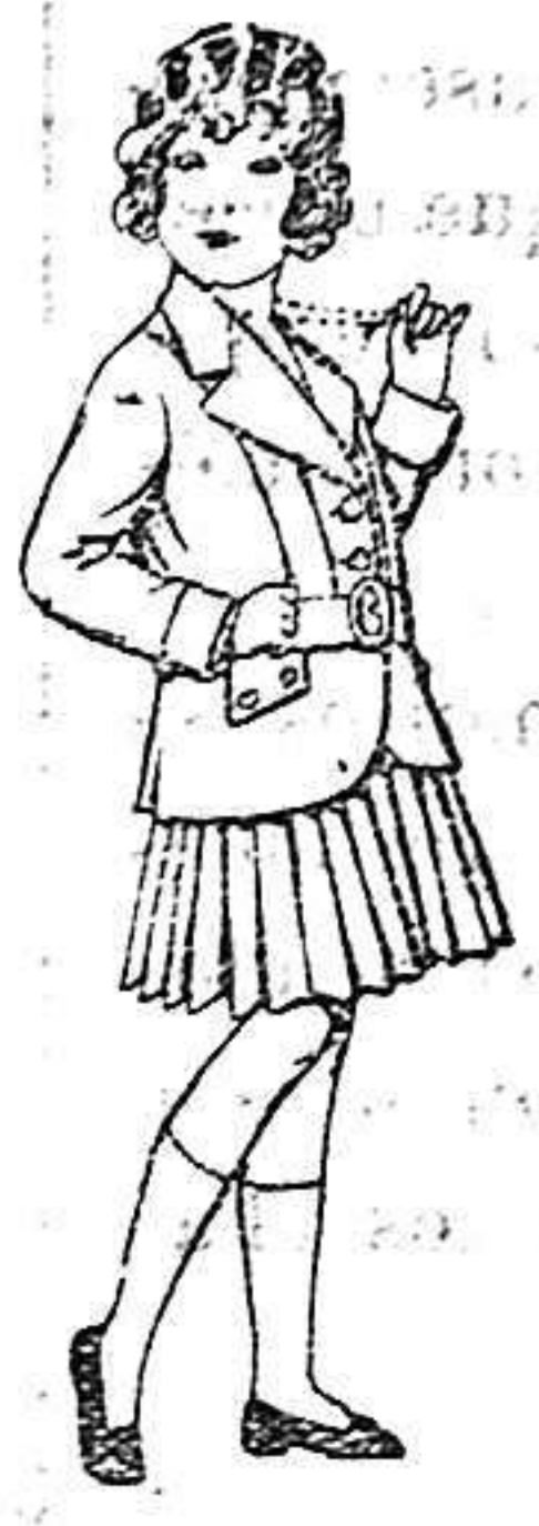
Trajes de lanilla para niñas de 4 a 11 años. De 20 a 35 ptas.