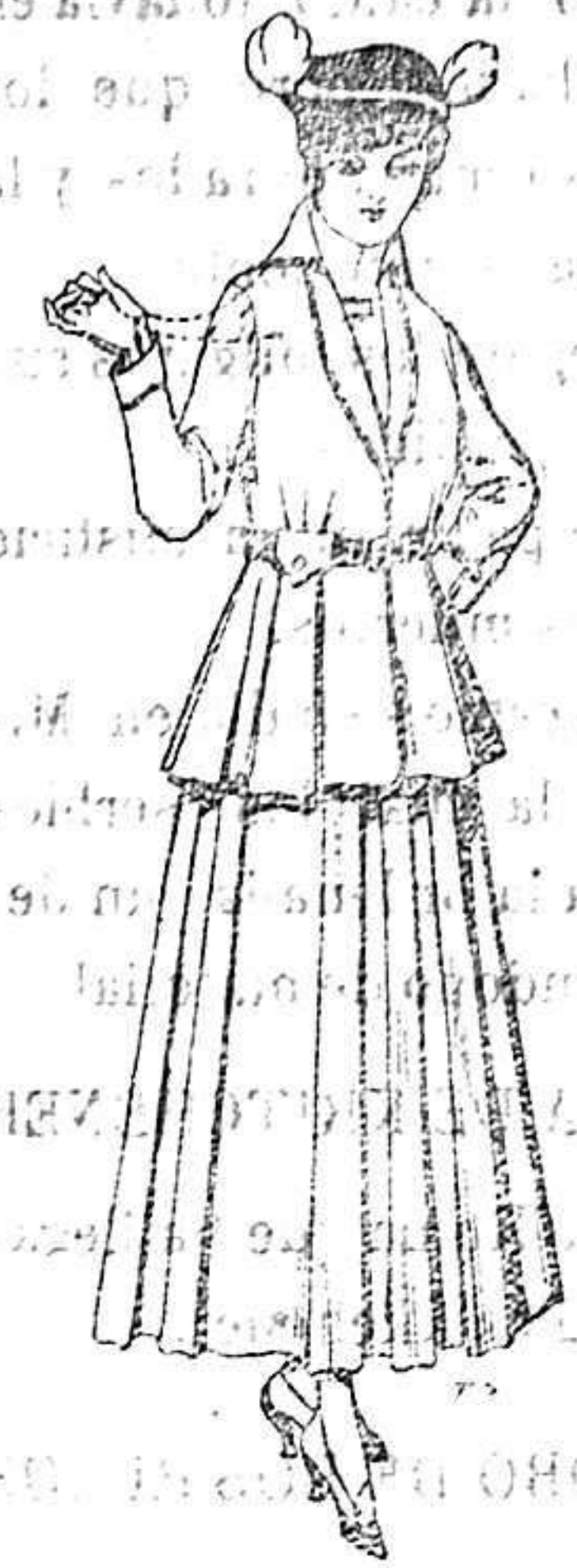
Trajes de lana negra, azul y color para señora. 455 ptas.

Peletería, Camisería, Géneros de Punto, Corbatería, Guantería, Sombrerería, Zapatería, Paraguas, Bastones y Artículos de Viaje.