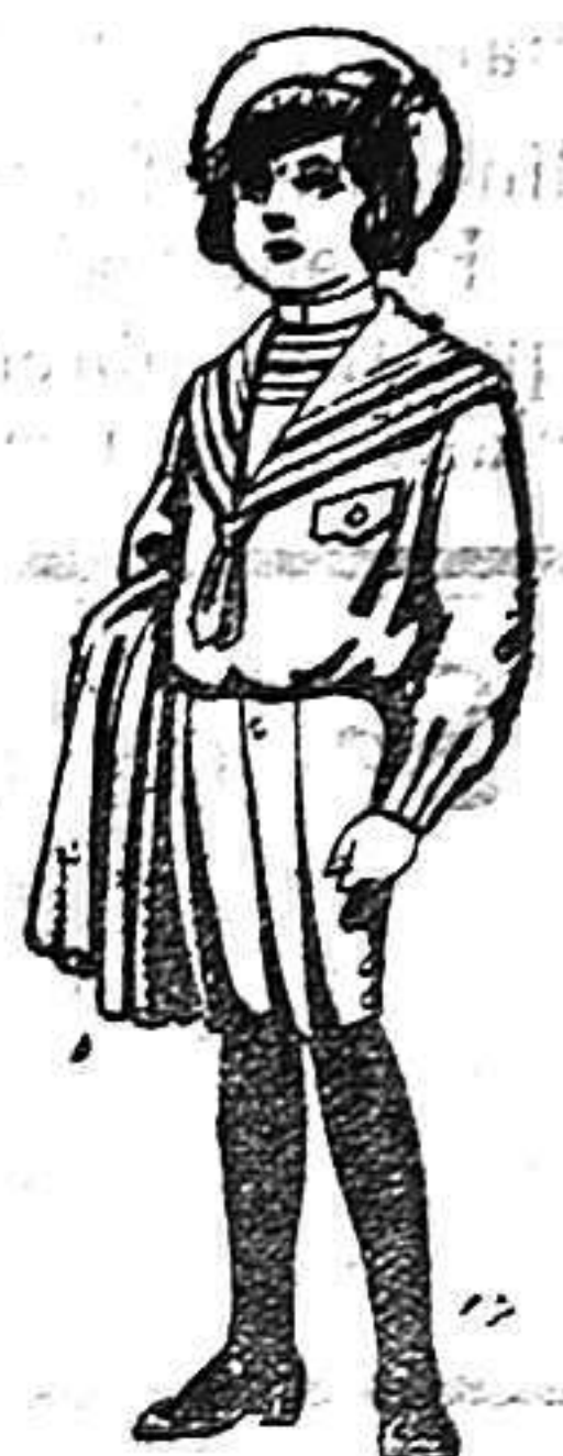
Trajes de jerga negra o azul para niños de 4 a 9 años. De 5 a 10 ptas

PRECIO FIJO -- VENTAS AL CONTADO PÍDASE EL CATÁLOGO GENERAL