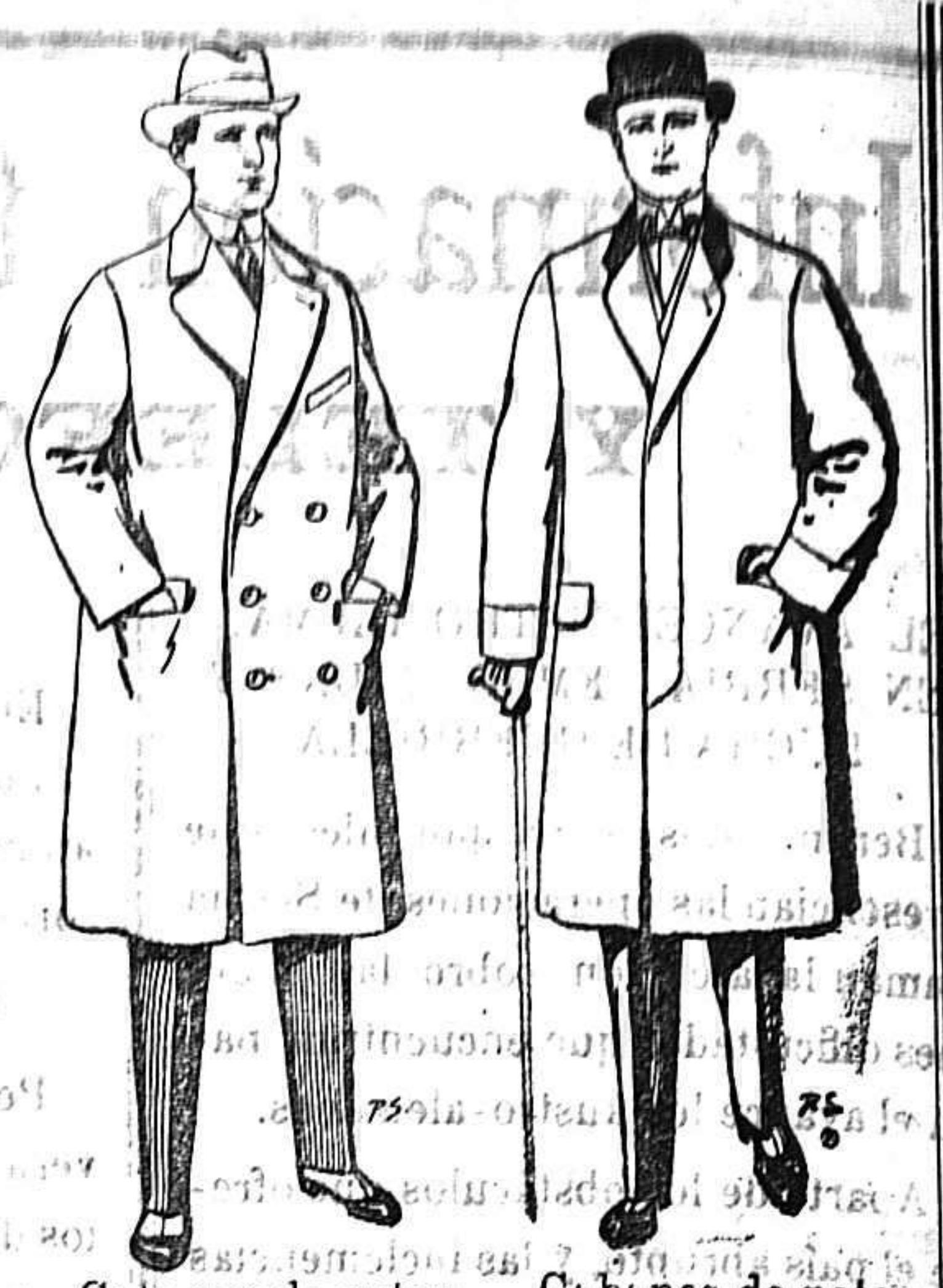
Gabanes de pátén cheviot etc. De 55 a 105 ptas. Gabanes de pátén melton o cheviot De 25 a 100 ptas.