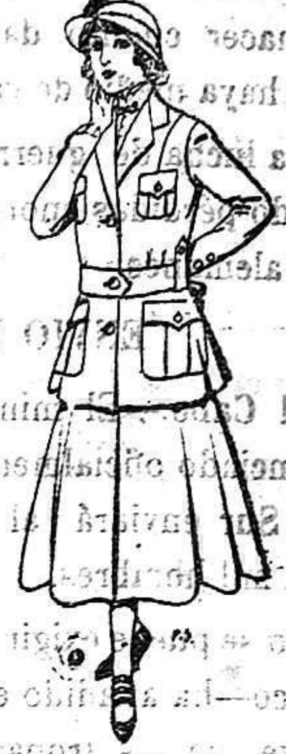
Trajes de lana para jovencitas de 13 a 16 años. De 40 a 45 ptas.