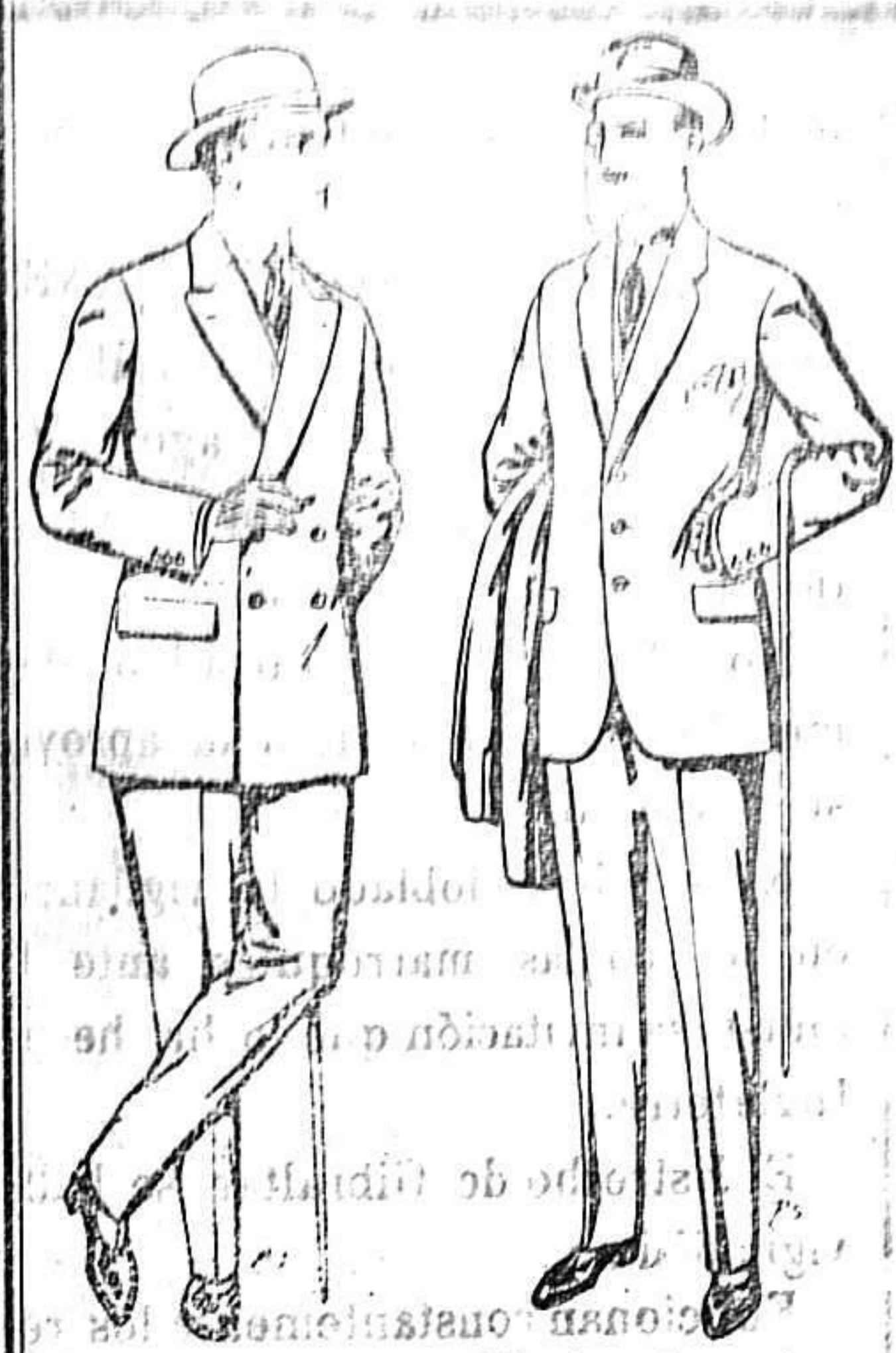
Trajes de cheviot, Trajes de pátén patén etc. De 27 a 85 ptas. De 17'50a 80 ptas