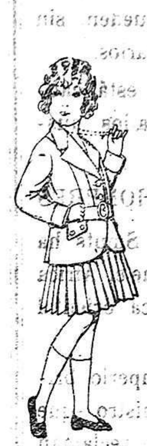
Trajes de lanilla para niñas de 4 a 11 años. De 20 a 35 ptas.