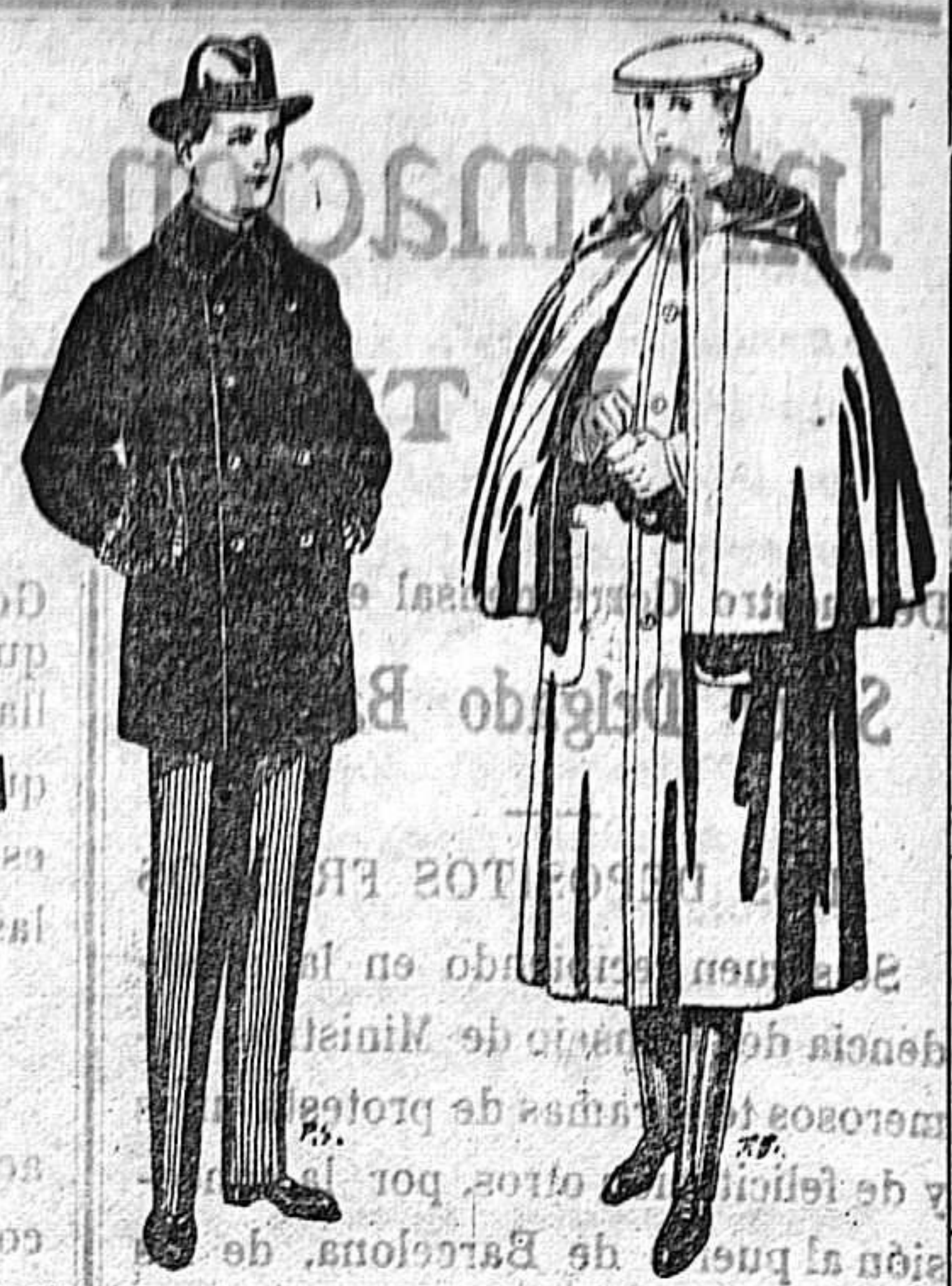
Pellicas con cuello y bocamangas astracán De 14 a 90 ptas. Impermeables, formo Mackferland en negro y azul De 55 a 110 ptas.