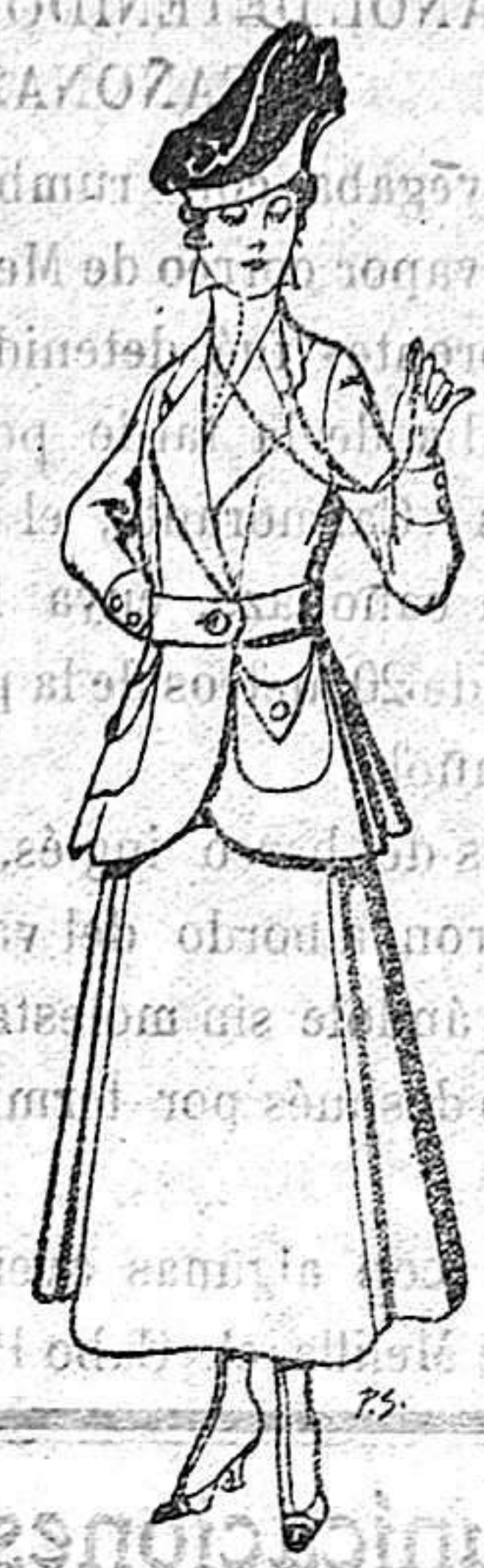
Trajes de lana negra, azul y color para señora De 50 a 55 ptas.