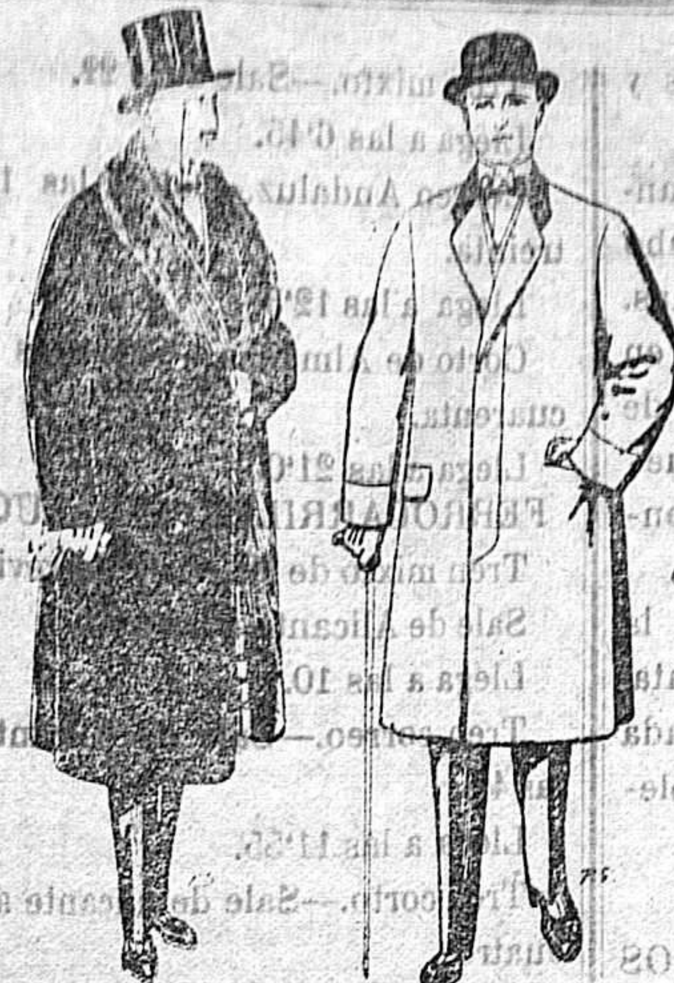
Gabanes de edredón negro forro seda cuello y vistas de piel A 125 y 135 ptas.

Peletería, Camisería, Géneros de Punto, Corbatería, Guantería, Sombrerería, Zapatería, Paraguas, Bastones y Artículos de Viaje.