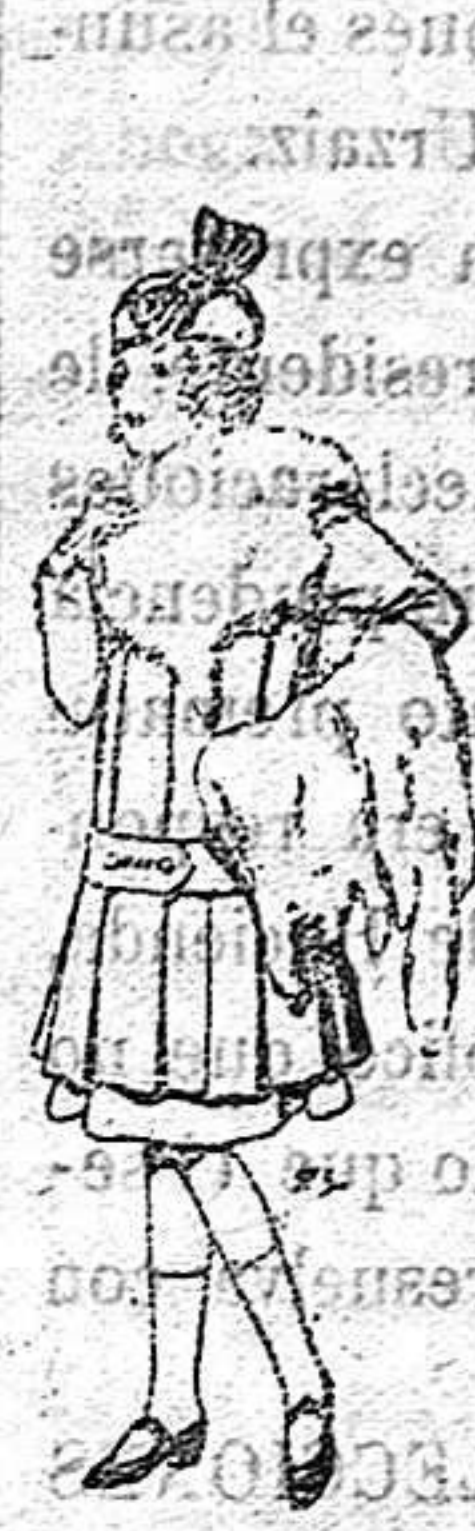
Juego de pieles para niñas A 15 ptas.