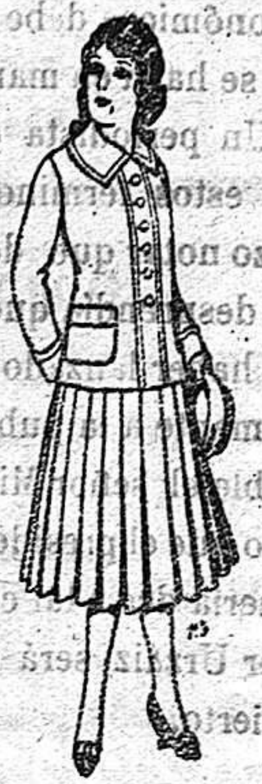
Paletor de lana para jovencitas de 13 a 16 años De 12.50 a 20 ptas.