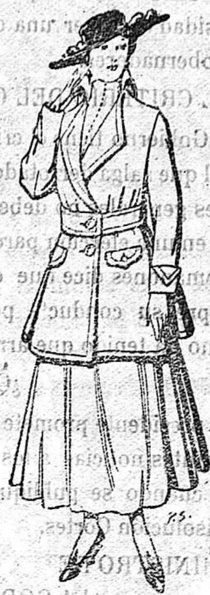
Abrigos de patén gran novedad para señora De 26 a 40 ptas.