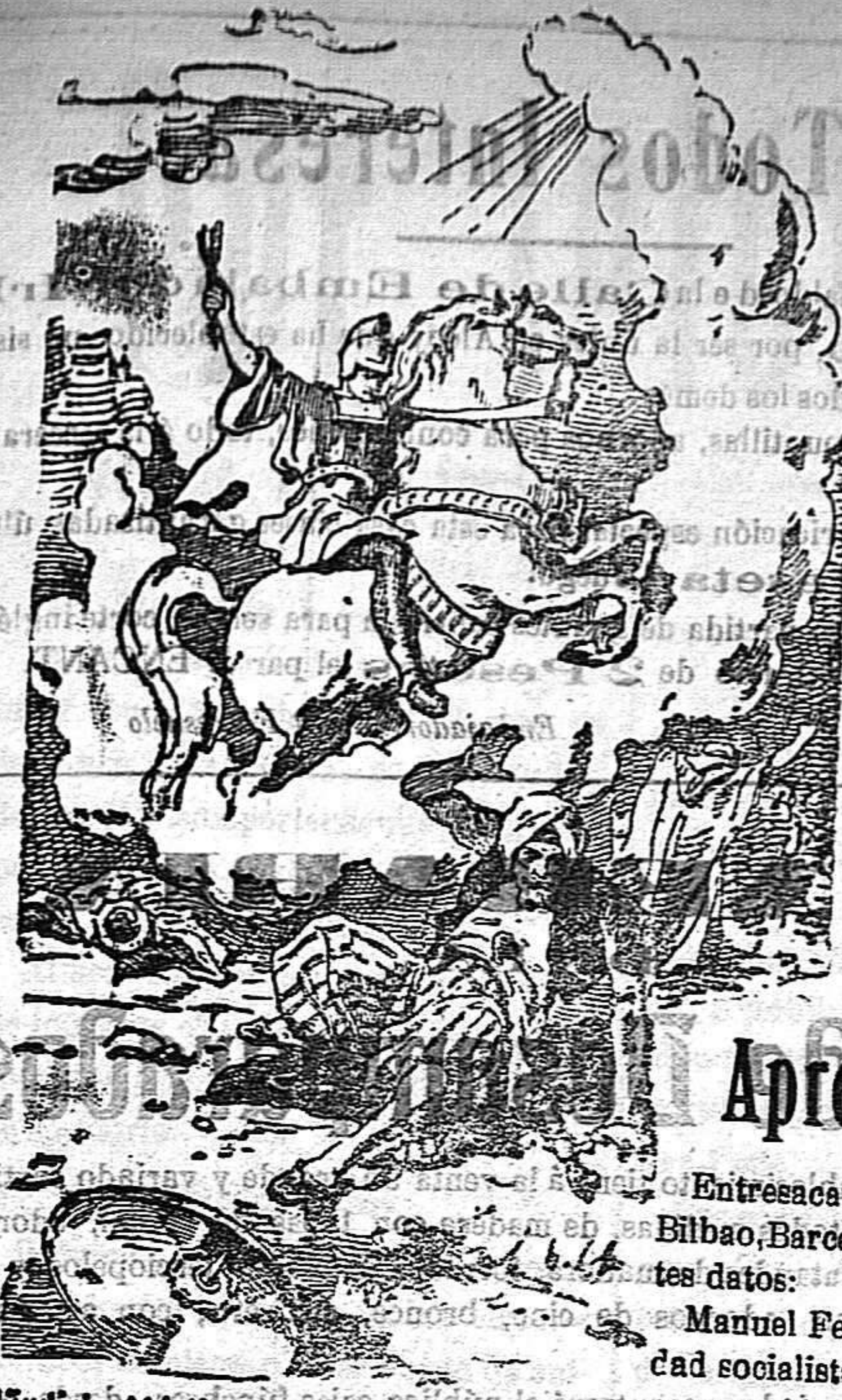
¡Juventud Mártir San Jorge!

Precios de suscripción: Alcoy al mes . . . . . 1'50 Ptas. Para los obreros al mes . . . . . 0'75 Ptas. Fuera al trimestre . . . . . 4'50 Ptas. Número atrasado . . . . . 0'15 Ptas.