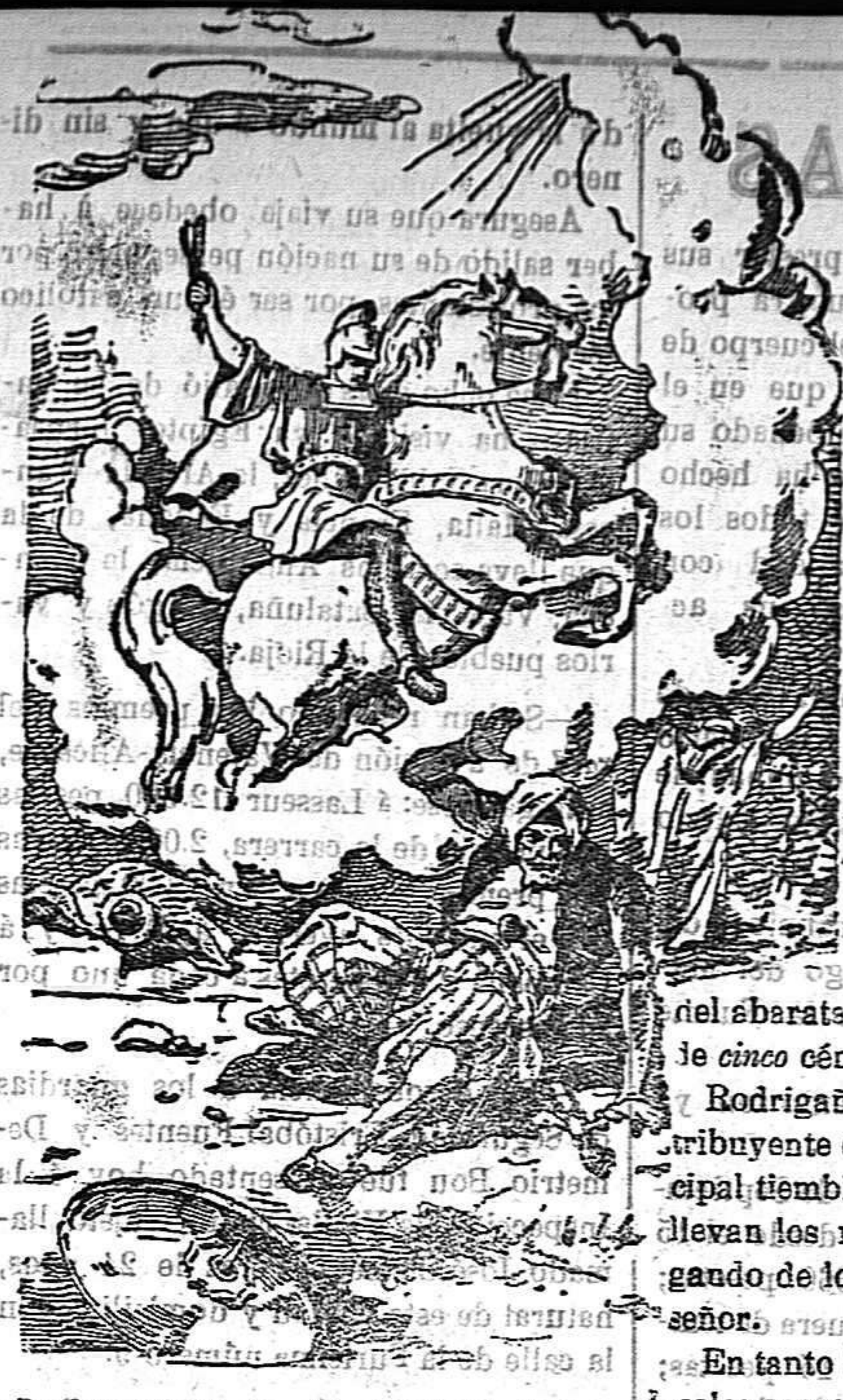
Juvicio Mártir San Jorge