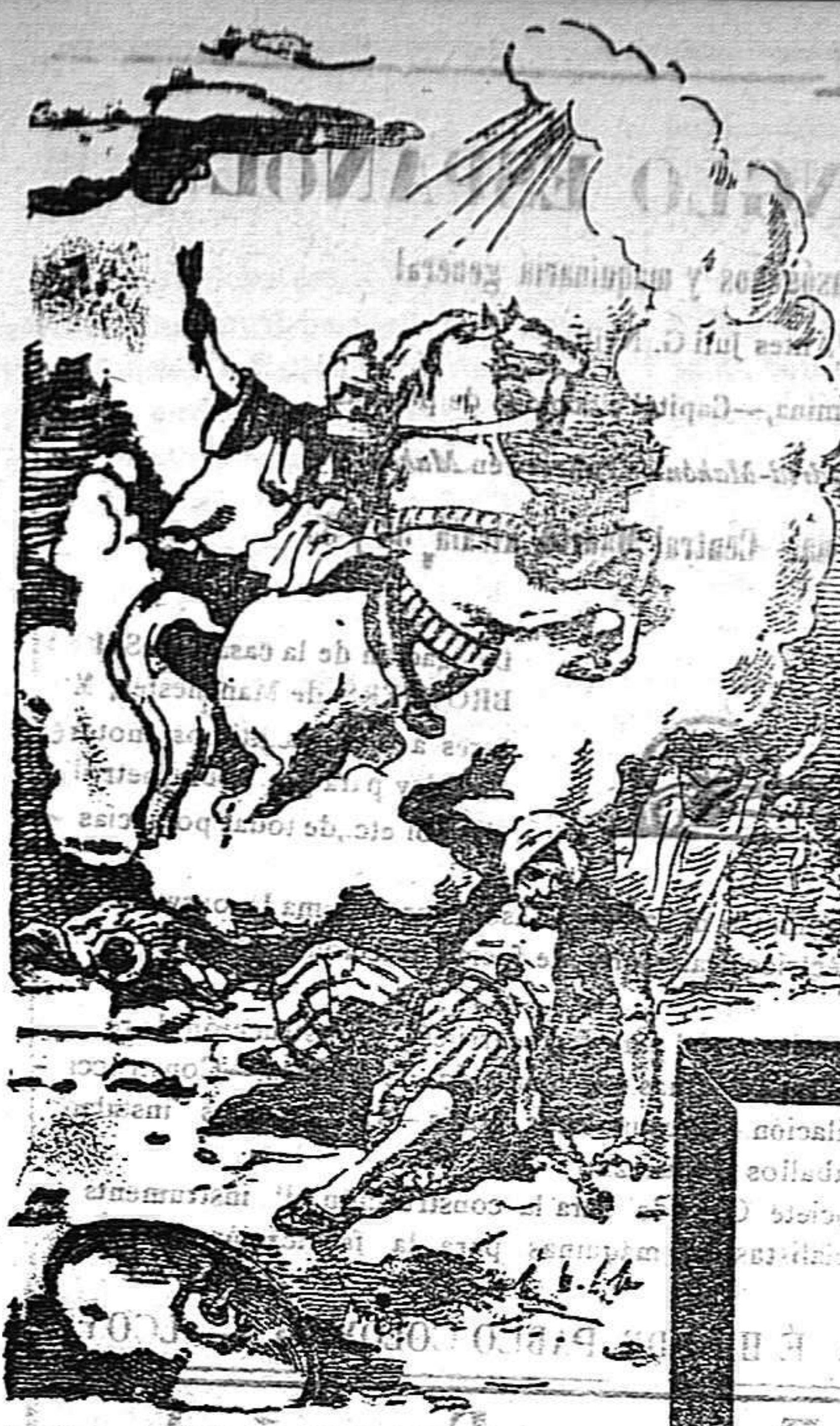
Invicto Mártir San Jorge Defiende al pueblo de Dios

Precios de suscripción Alcoy al mes . . . . . 1'50 Ptas. Para los obreros al mes . . . . . 0'75 Ptas. Fuera al trimestre . . . . . 4'50 Ptas. Número atrasado . . . . . 0'15 Ptas.