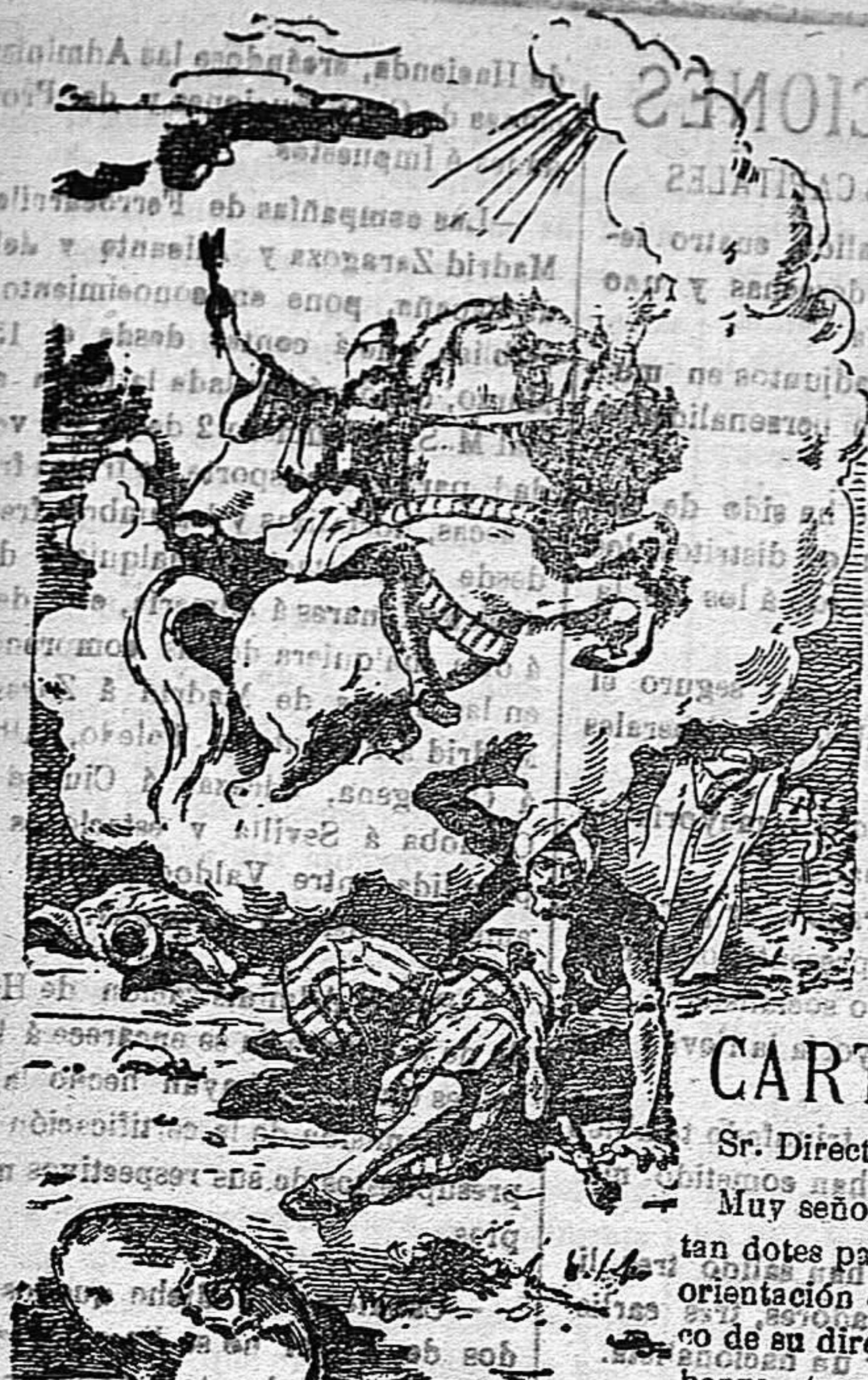
¡Victo Mártir San Jorge!

Redacción y Administración Calle Pintor Casanova N.º 24