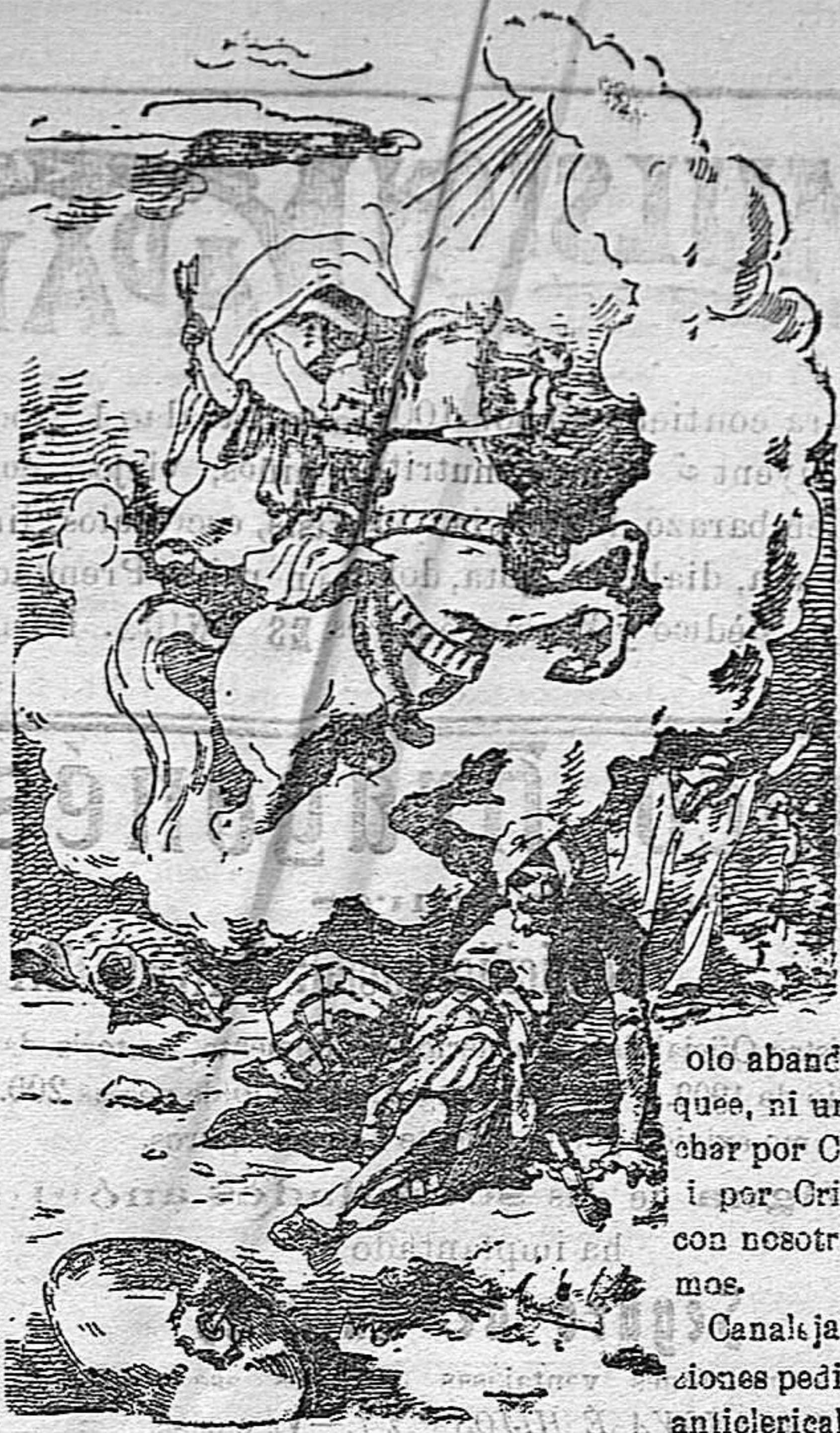
Invierno Mártir San Jerge Defiende al pueblo de Dios

Redacción y Administración Calle Pintor Casanova N.º 24