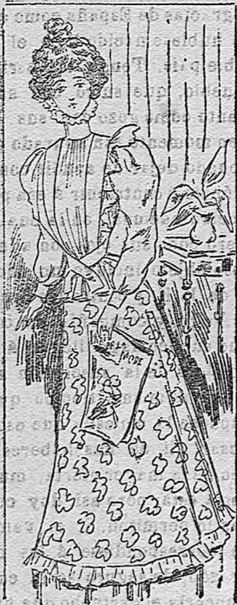
TRAJE PARA CASA

Blusa de seda pongé, entallada en la espalda y floja en el delantero; canesú de alforitas formando escote cerrado, y alrededor de éste una ruxa de encaje; cuello también de encaje; mangas lisas y falda de crespón de lana con un bonito galón en el borde.