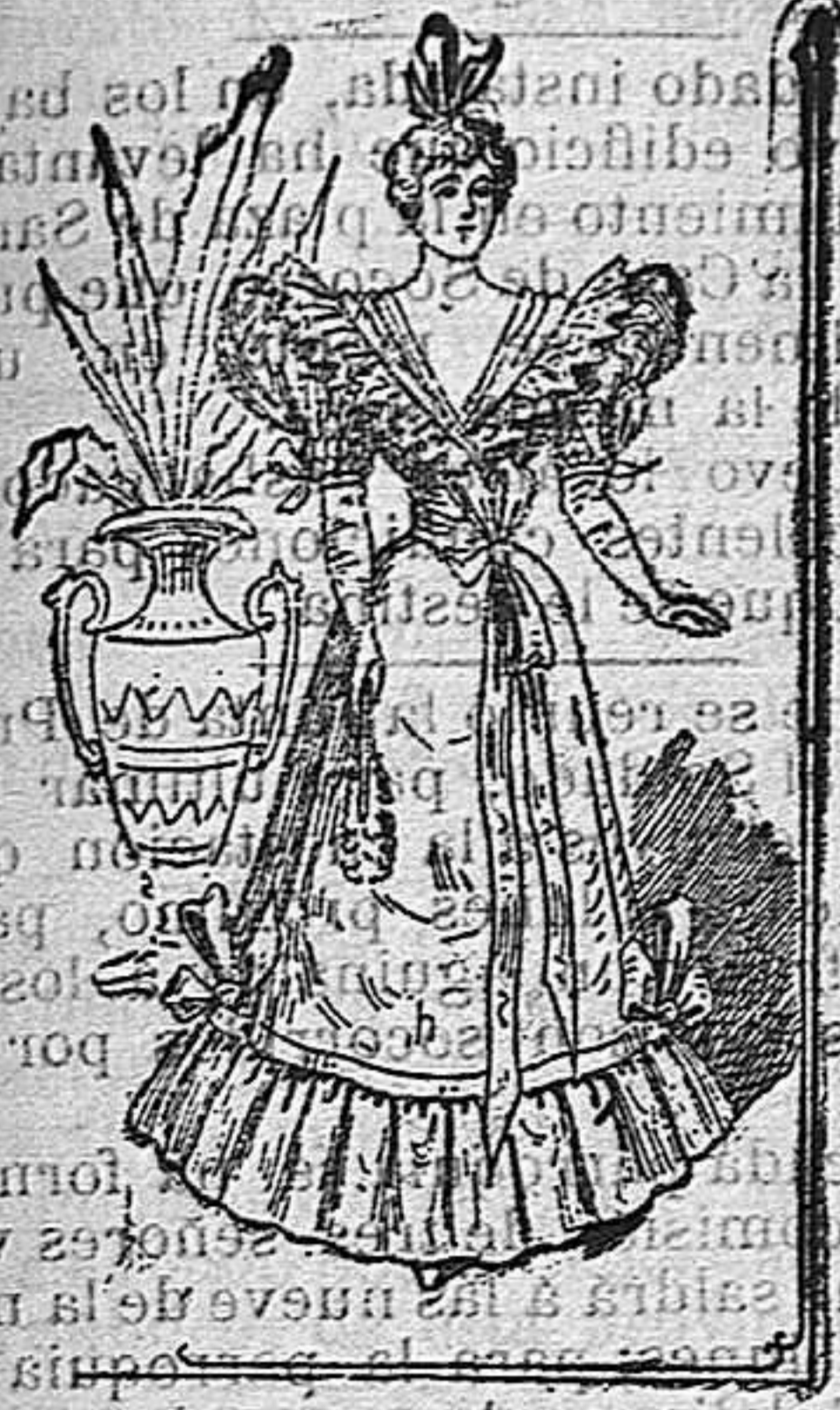
Traje para soiree

De Sarah, guapo entallado y escotado, lo mismo en la espalda que en el delantero, alrededor del cual va un fichú de gase, con encaje, que cruza el lado izquierdo con un bonito lazo de cinta. Las mangas forman un pequeño bollo y van recibidas con un lazo.