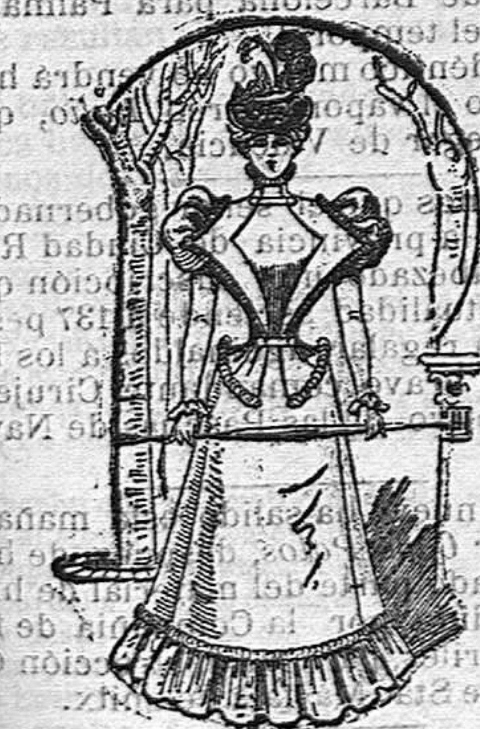
Otro traje para paseo

Falda acampanada con una ancha tira de piel en el borde.