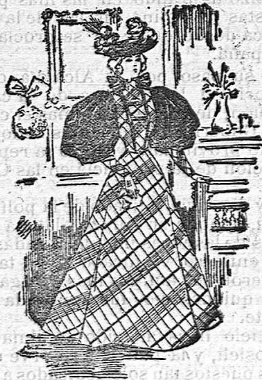
Traje de visita

Aquellas de nuestras lectoras que deseen deta- lles de los modelos de la presente revista, pueden es- cribir á la Sección de confecciones de los Grandes Almacenes de El Siglo , Barcelona; y recibirán grá- tis inmediata contestación.