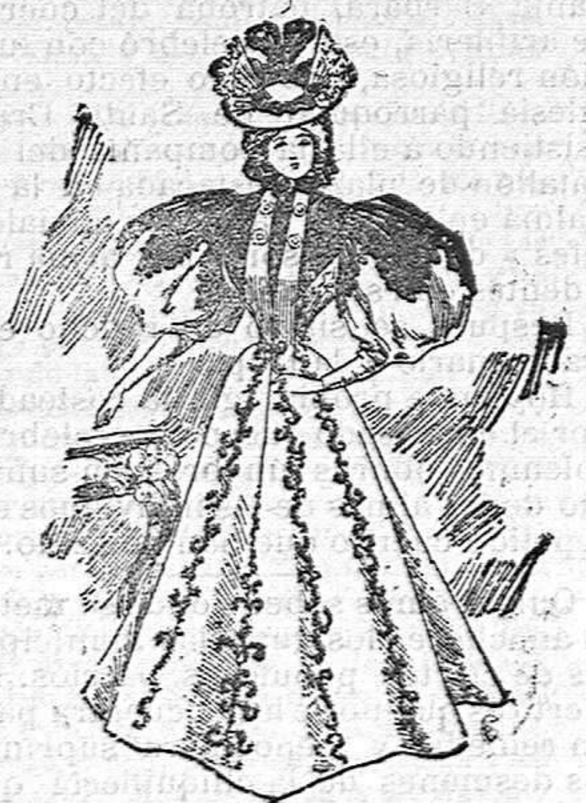
Traje de visita

Podeis hacerla de paño Sedan, y forrarla de Surah. Con esto y con bordarla luego con bonitos dibujos en soutache de seda, tendreis un dibujo precioso, elegante, y relativamente barato, que así os servirá para paseo, como podreis utilizarlo para salida de teatros. No olvidéis de cortar alto el cuello de esta esclavina, que deberá ir además doblado.