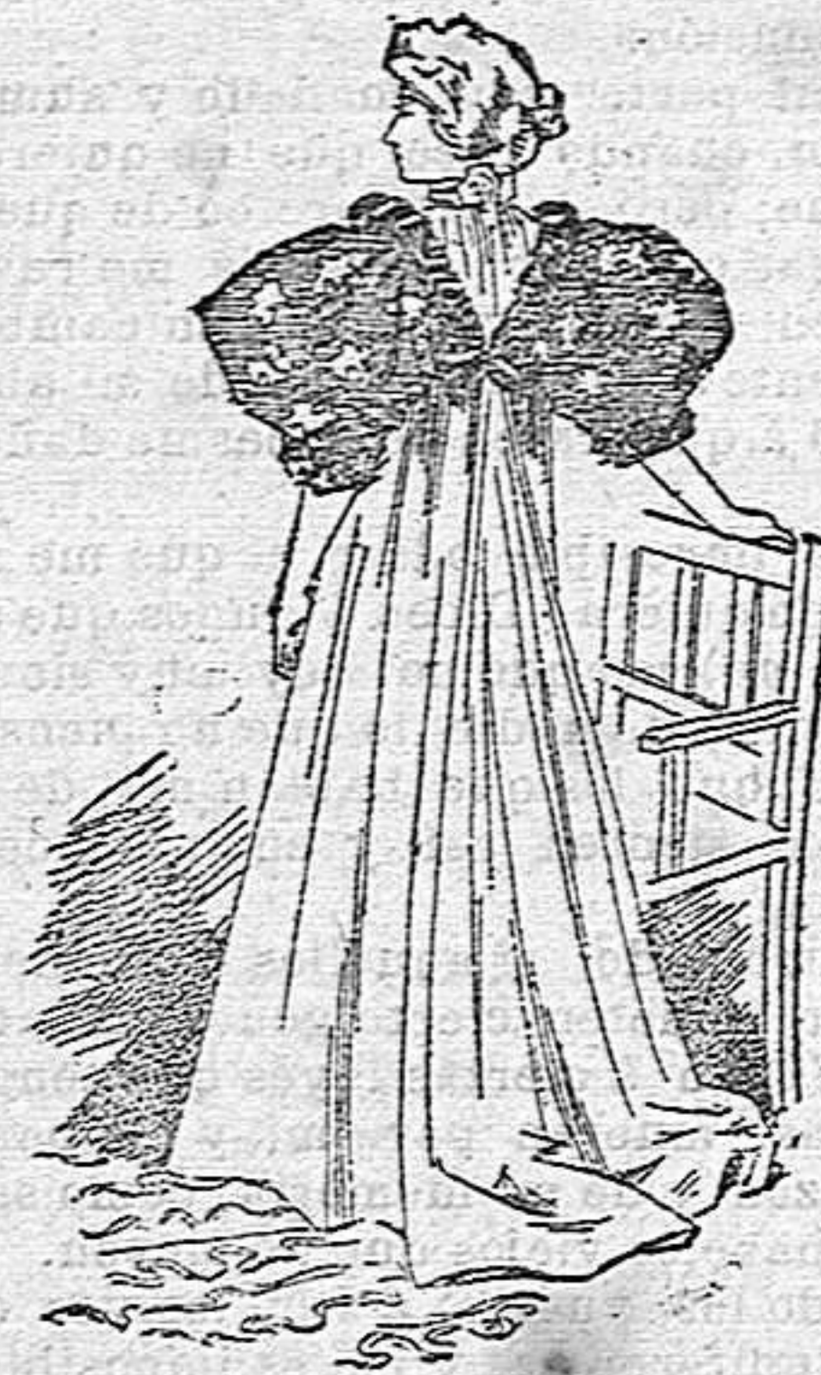
Bata de visita

Por último, la falda es acampanada, y en su delantero se adorna con cinco tiras bordadas en soutache.