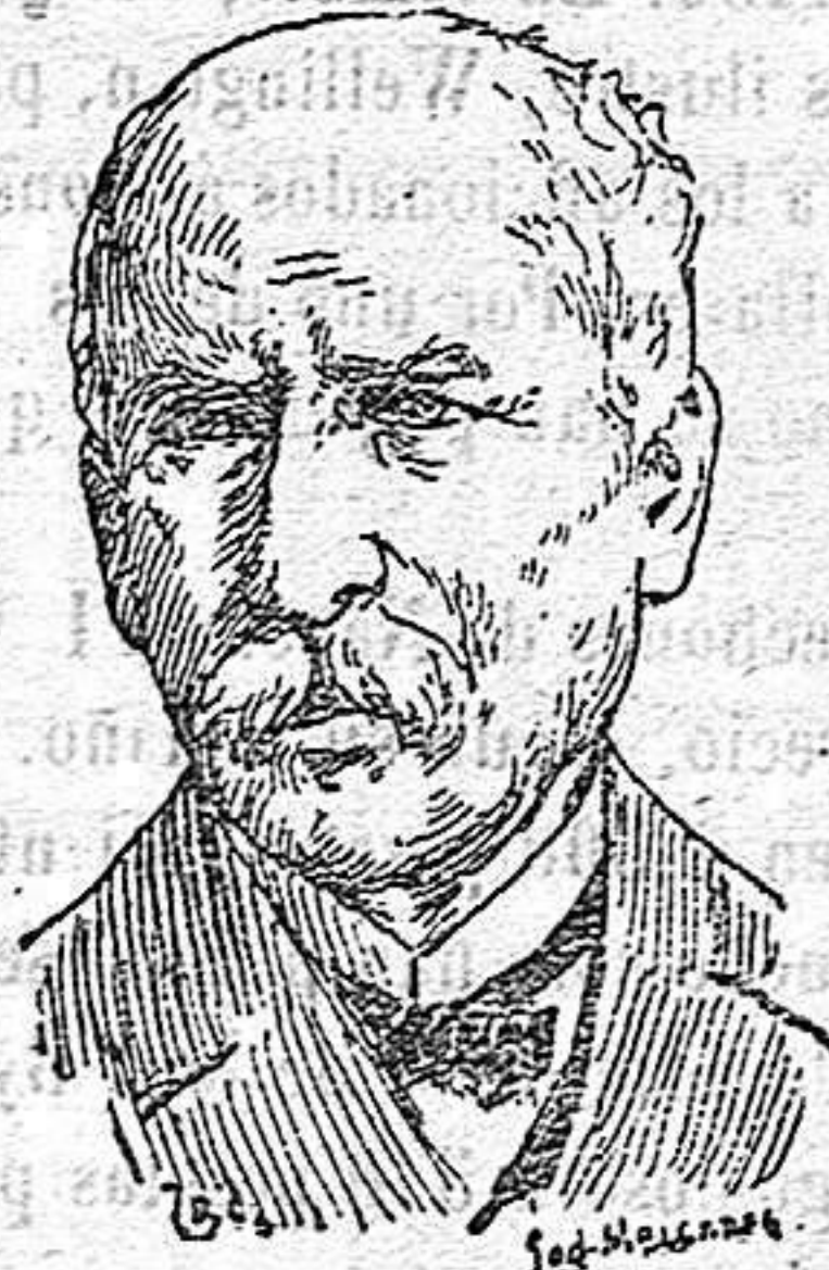
D. Manuel García

Bien es verdad que la invención del laringoscopio produjo una verdadera revolución en el campo de la cirugía, pues merced á él pudo explorarse el órgano vocal perfectamente y diagnosticarse y tratarse el cáncer laríngeo como antes era posible.