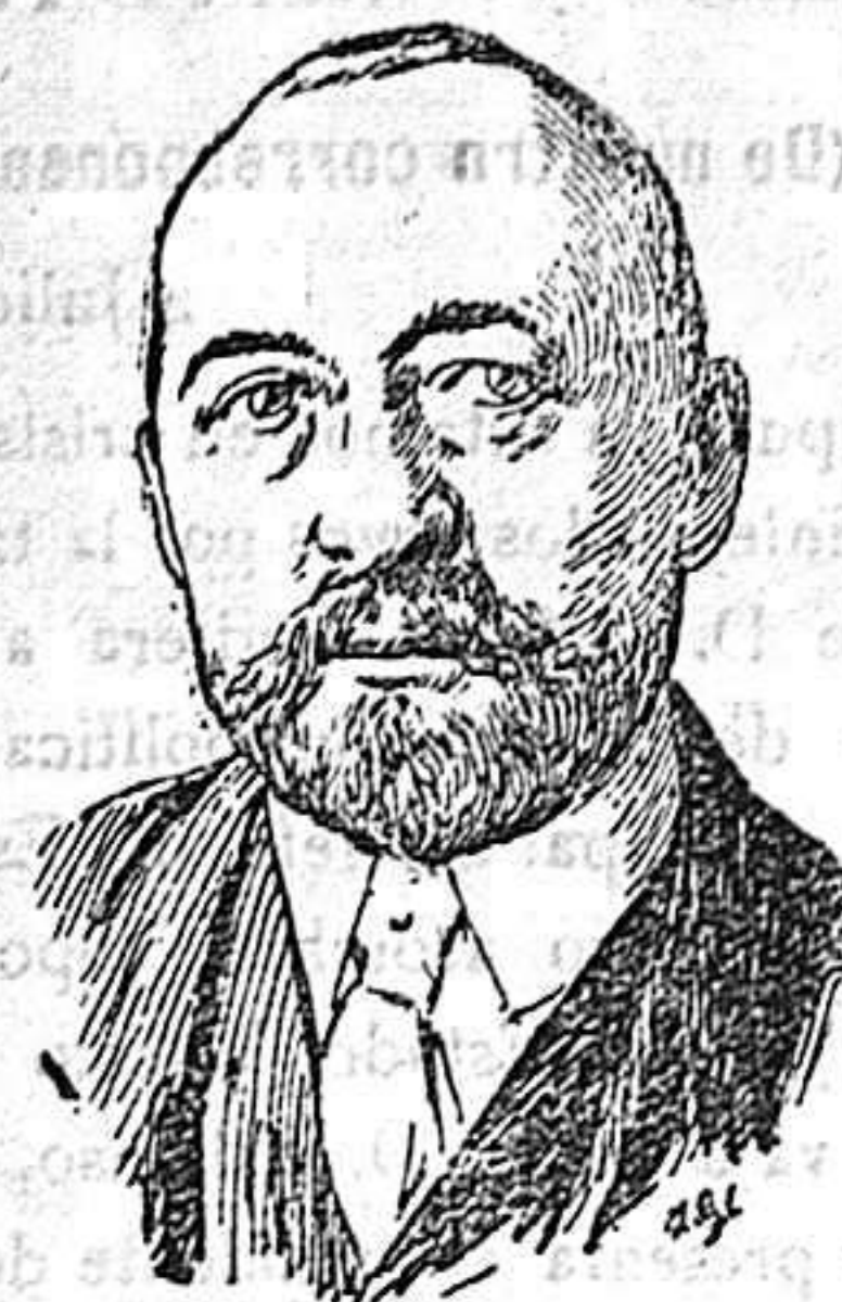
El Doctor Behring.

Sabido es que este meritisísimo sabio anunció en Octubre último, ante los miembros del Congreso internacional de la tuberculosis, que sus trabajos le permitían afirmar que estaban en vías del descubrimiento de un principio, á la vez prevenido y curativo, de tan terrible dolencia.