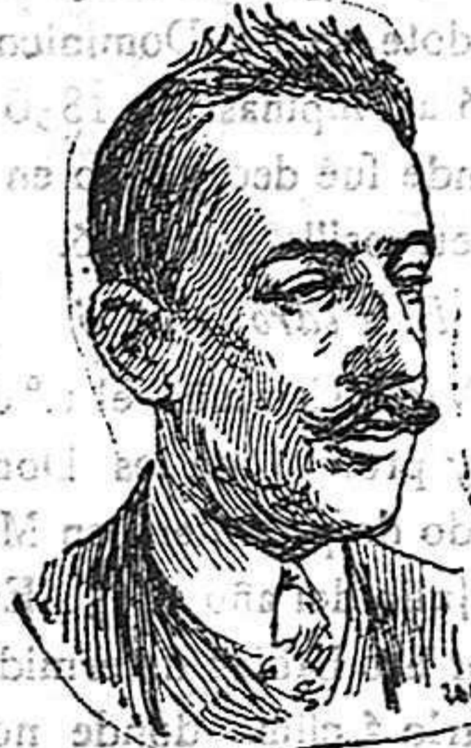
Retrato de Mateo Moral