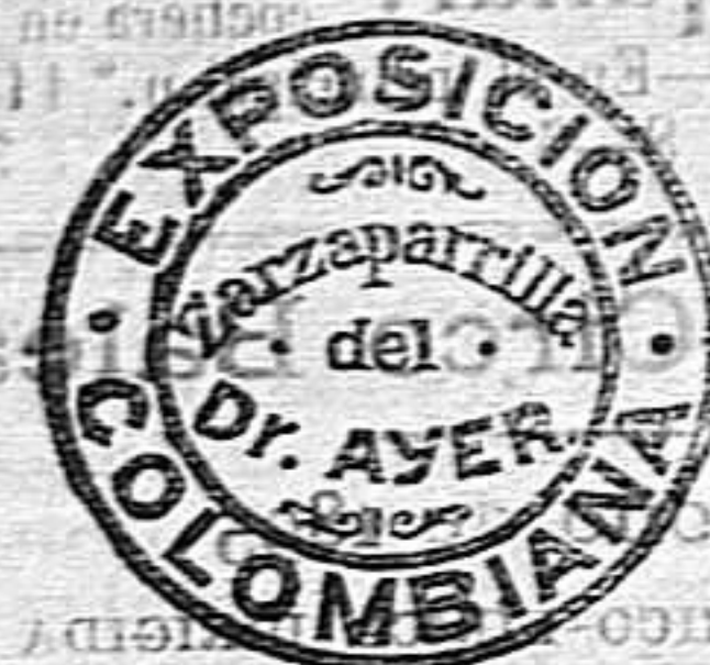
Figura en guardia en cada una de nuestras botellas. El nombre de "Ayer's Sarsaparilla" figura en la envoltura, y está vaciado en el cristal de cada una de nuestras botellas.

Preparada por el Dr. J. C. Ayer & Co., Lowell, Mass., E. U. A.