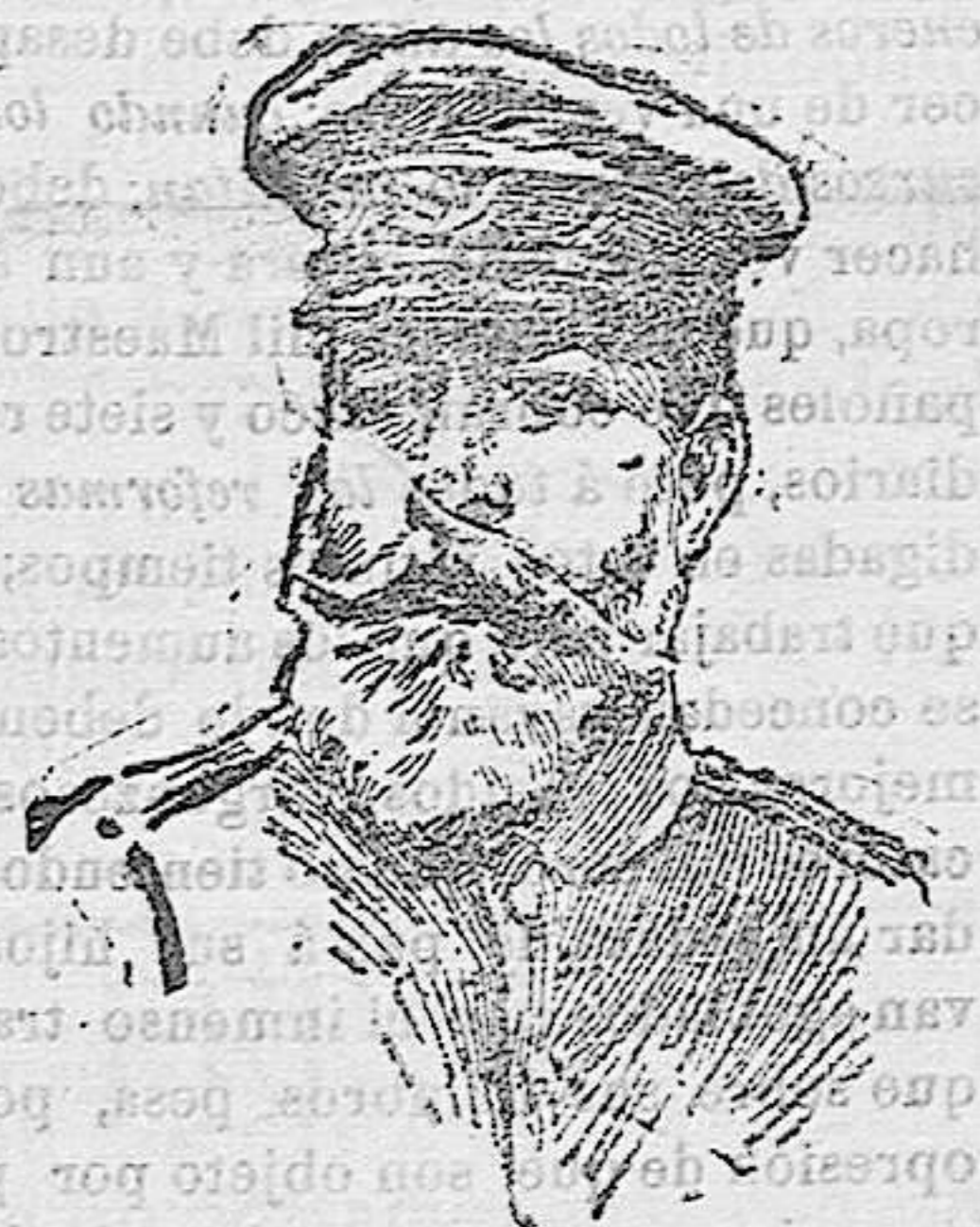
EL GENERAL MARINA

acostumbrados las intrigas y las ambiciones que parecen obligados parásitos de los centros del poder y de la política.