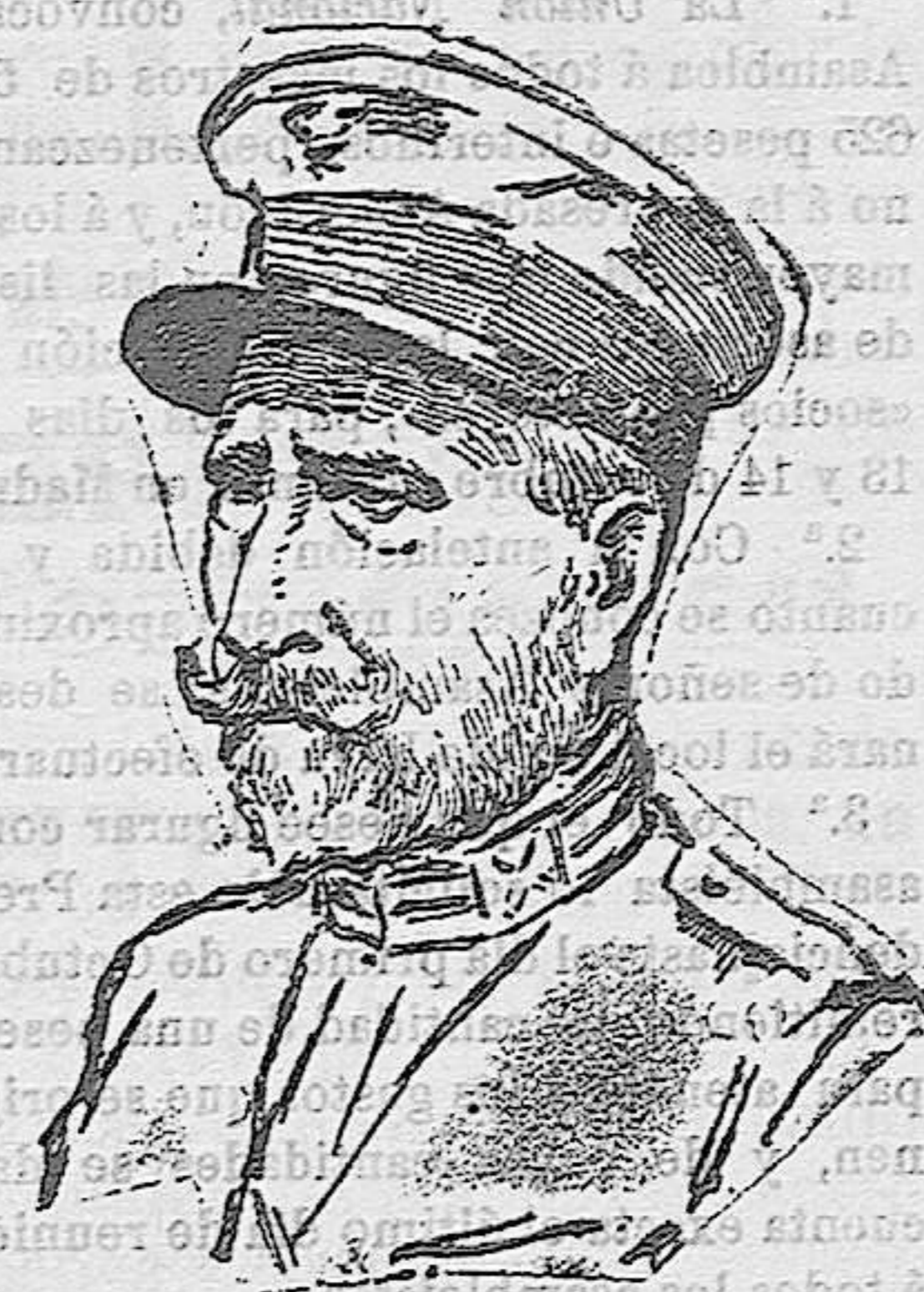
EL GENERAL ALFAU

Los amigos del general Alfau, y no pocos de los que saben muy bien lo que pasa entre los bastidores políticos, presentan a la simpática figura