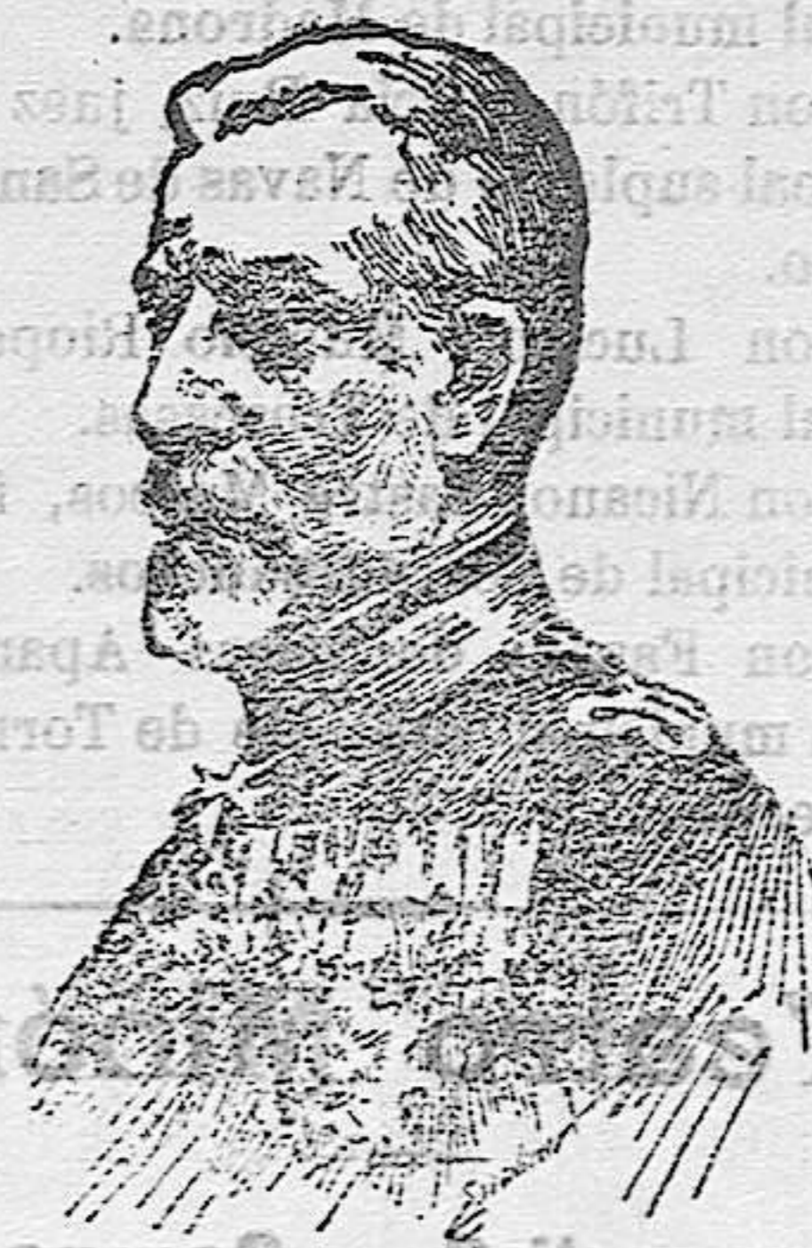
Carlos I de Rumania

El Ejército rumano ha pasado el Danubio é invadido el territorio búlgaro, previa la ruptura diplomática y la declaración de guerra.