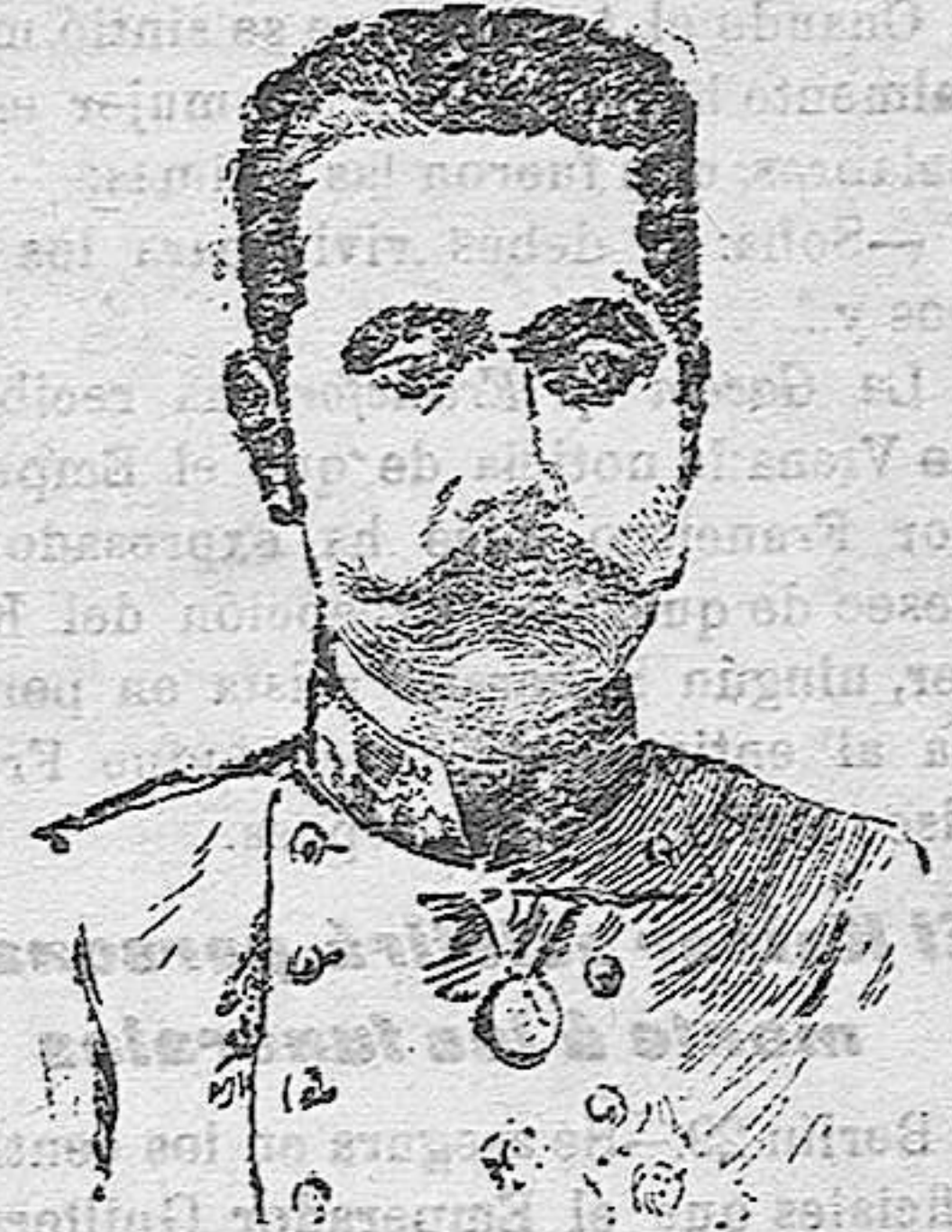
EL ARCHIDUQUE FRANCISCO FERNANDEZ

Paris 29.—La ciudad de Sarajevo ofrece un aspecto desolador. Los comercios y cafés están cerrados; la población civil encerrada en su casa, y sólo recorren la población patrullas militares, con bayoneta calada.