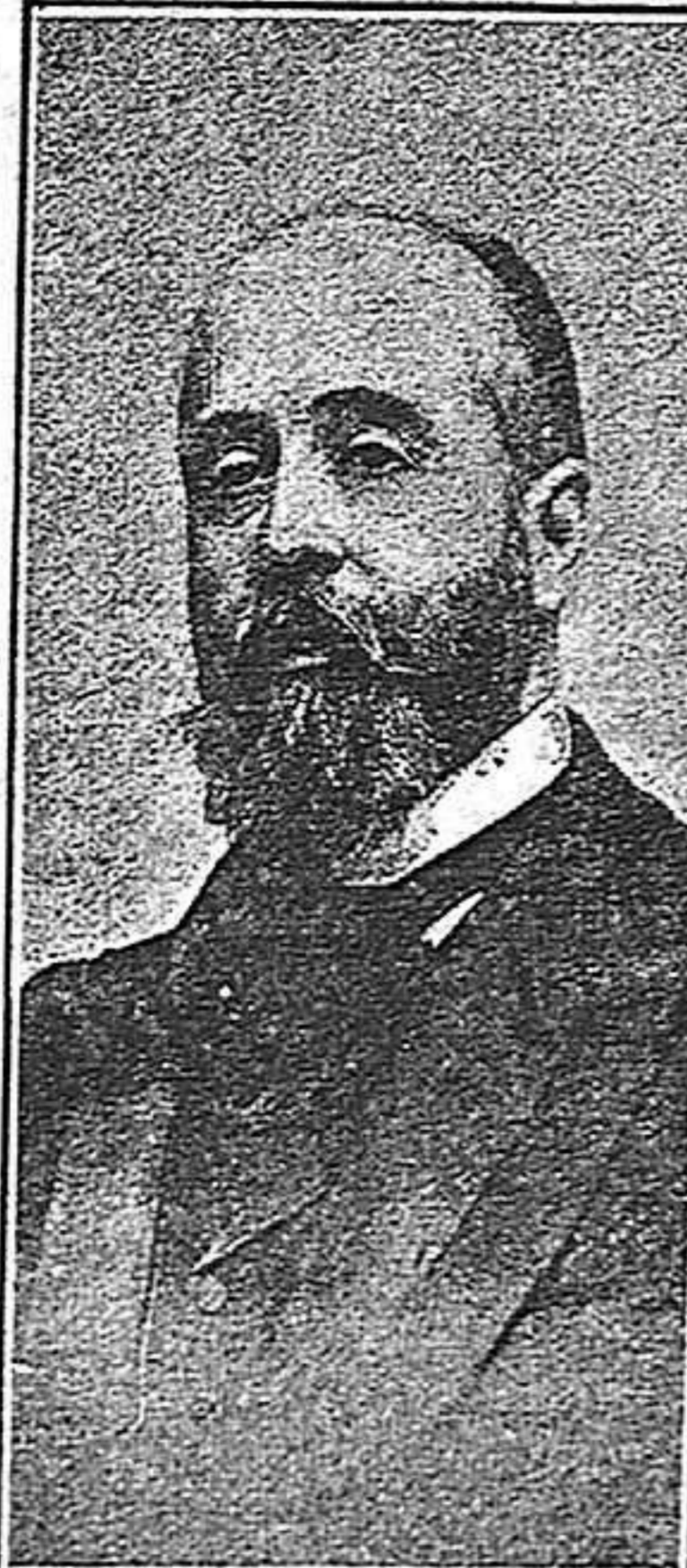
D. SEGISMUNDO MORET

Moret fué el orador de siempre. Su palabra todo lo agranda, lo junta y lo armoniza.