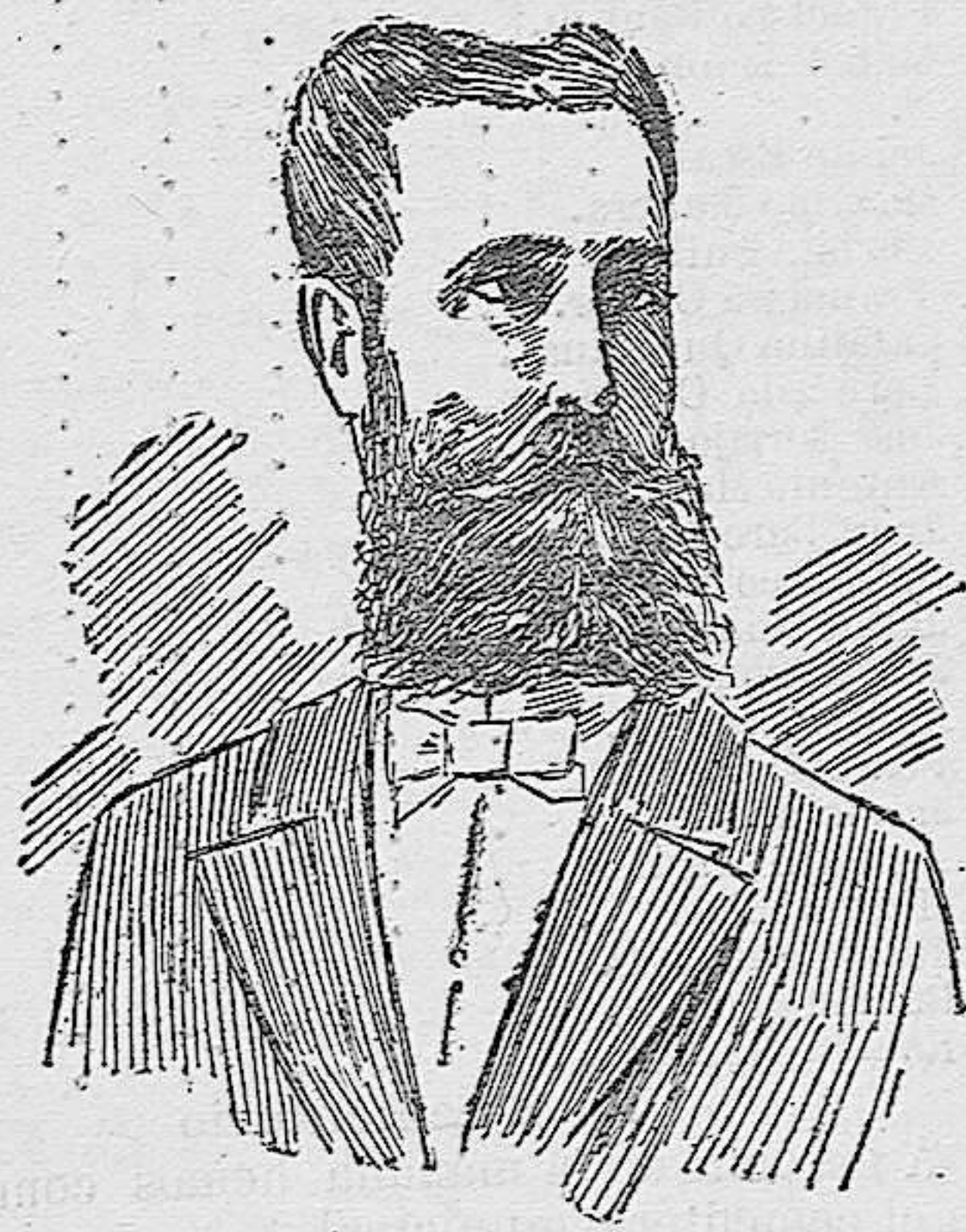
D. JULIO DE URBINA Marqués de Cabriñana

El Marqués de Cabriñana ayer casi desconocido es hoy el hombre más popular de España.