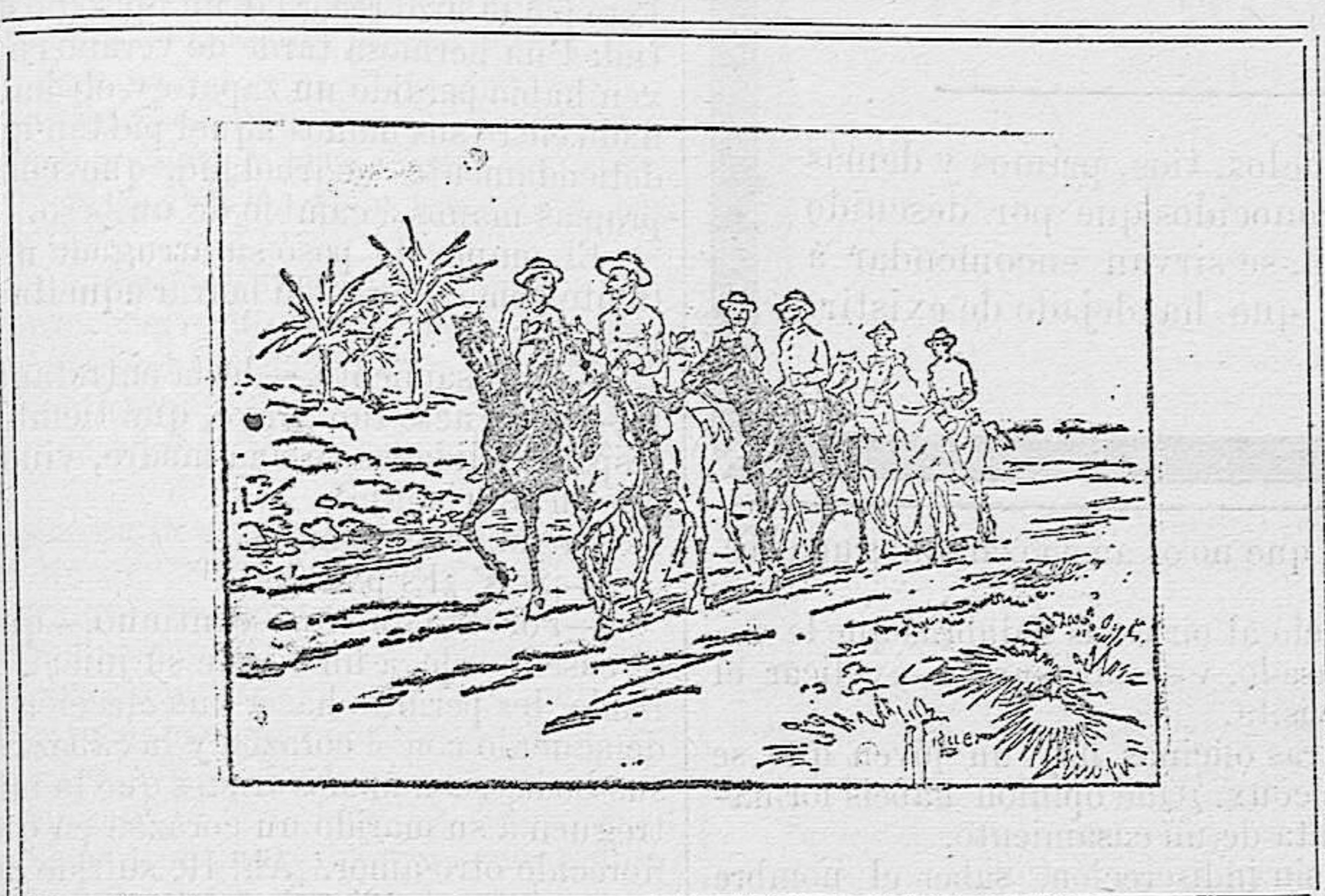
Máximo Gómez y su escolta