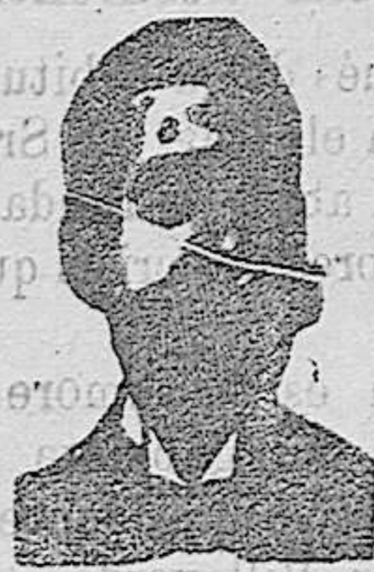
Angelo Costanzi Diputación, 435, et.º Barc.