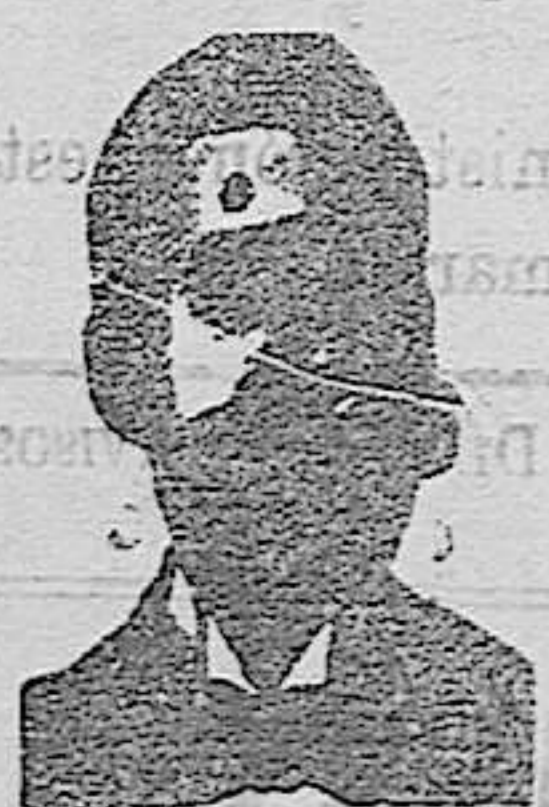
Angelo Costanzi Diputación, 435, et.º Barc.º