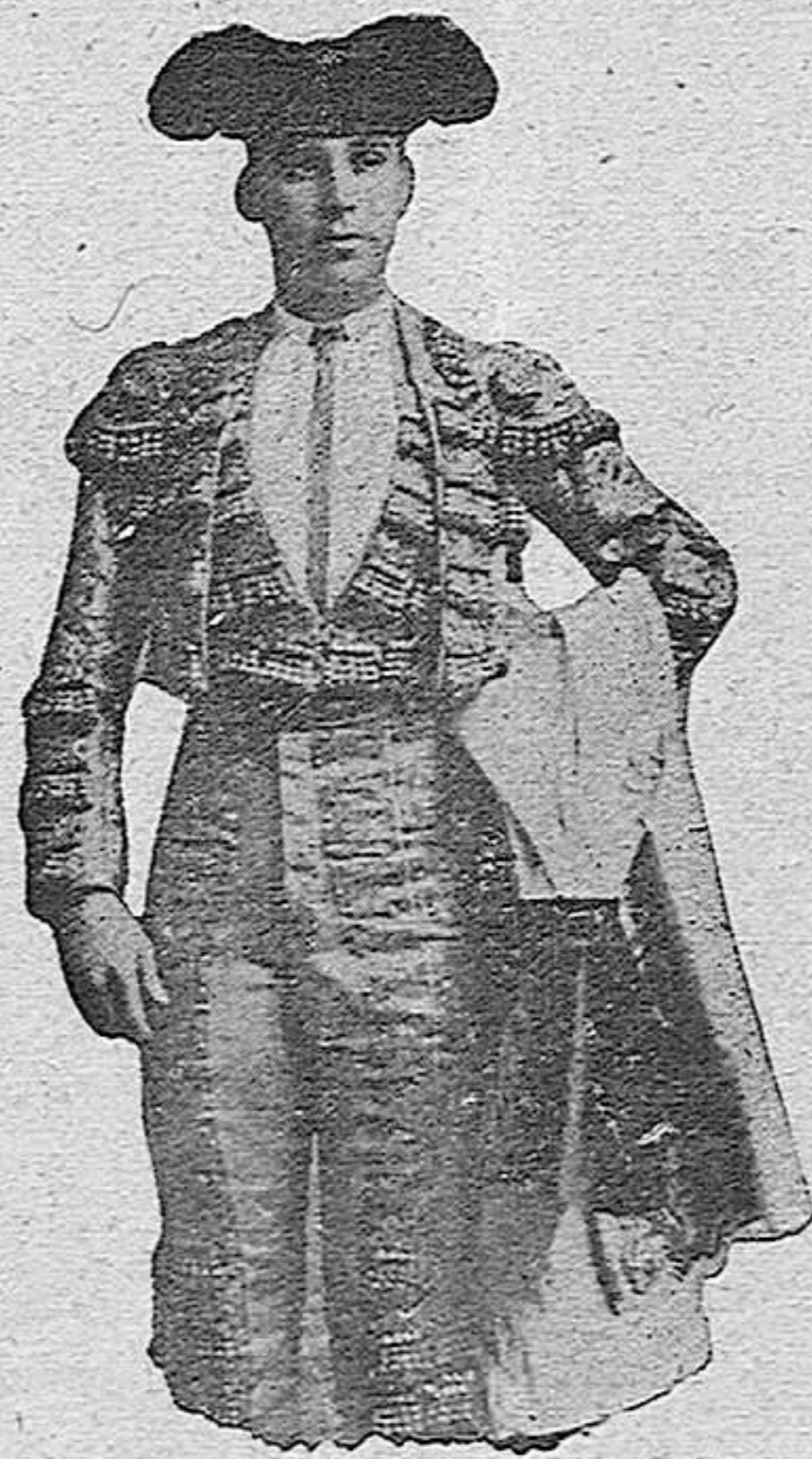
RAFAEL GUERRA (GUERRITA)

EL BURLADERO, que siente verdadero cariño por Guerrita le envía desde sus columnas un humilde pero caluroso saludo.