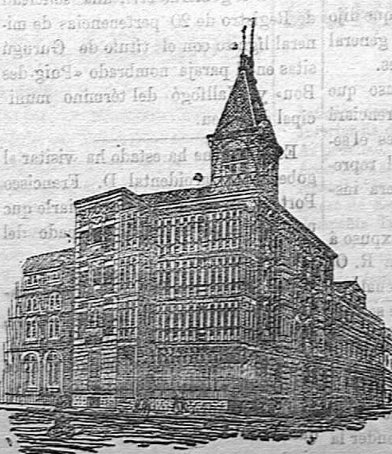
Edificio propio de la Sociedad en Pamplona

Los pedidos en Baleares pueden dirigirse al Teniente Abanderado de Artillería.—PALMA