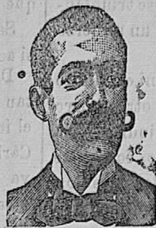
A. SALVATI COSTANZI Calle Diputacion, 435 BARCELONA.

Imp. de Hemeterio García Pérez, Fernández Cadórniga, 8, (antes Concepcion.