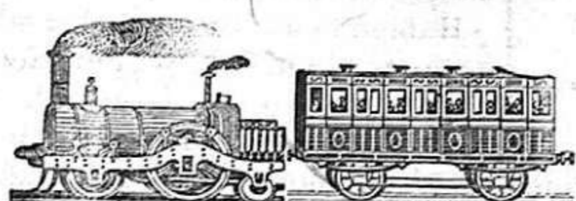
Ferro-Carriles de Mallorca