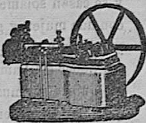
Máquina de vapor Horizontal.

Catálogos gratis y francos á quien los pida.