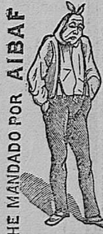
HE MANDADO POR AIBAF

Abierto del 15 de Junio al 15 de Septiembre. Tres mesas. Baratura y confort. Bille-tes, Jardines 15.