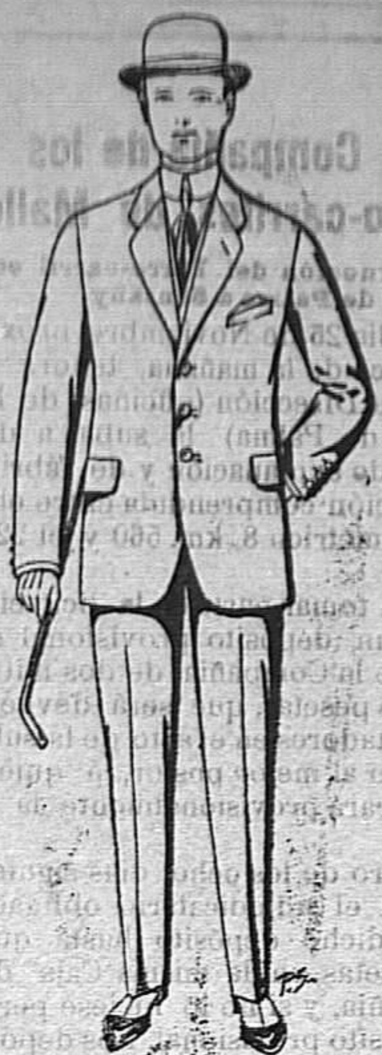
Trajes de cheviot paten etc. De ptas. 17'50 a 70.