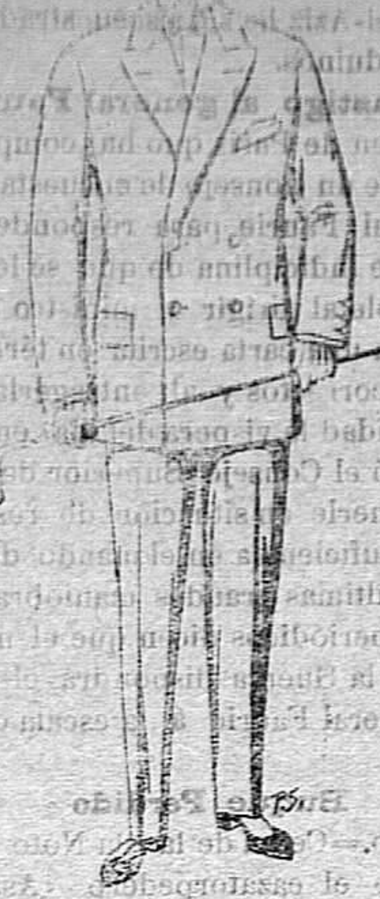
Trajes de paten cheviot etc. De ptas. 25 a 80.