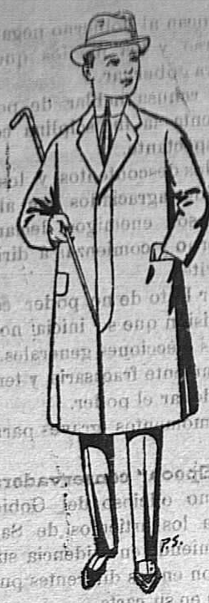
Gabanes de lana para juven- cios de 10 a 16 años. De ptas. 14 a 50.