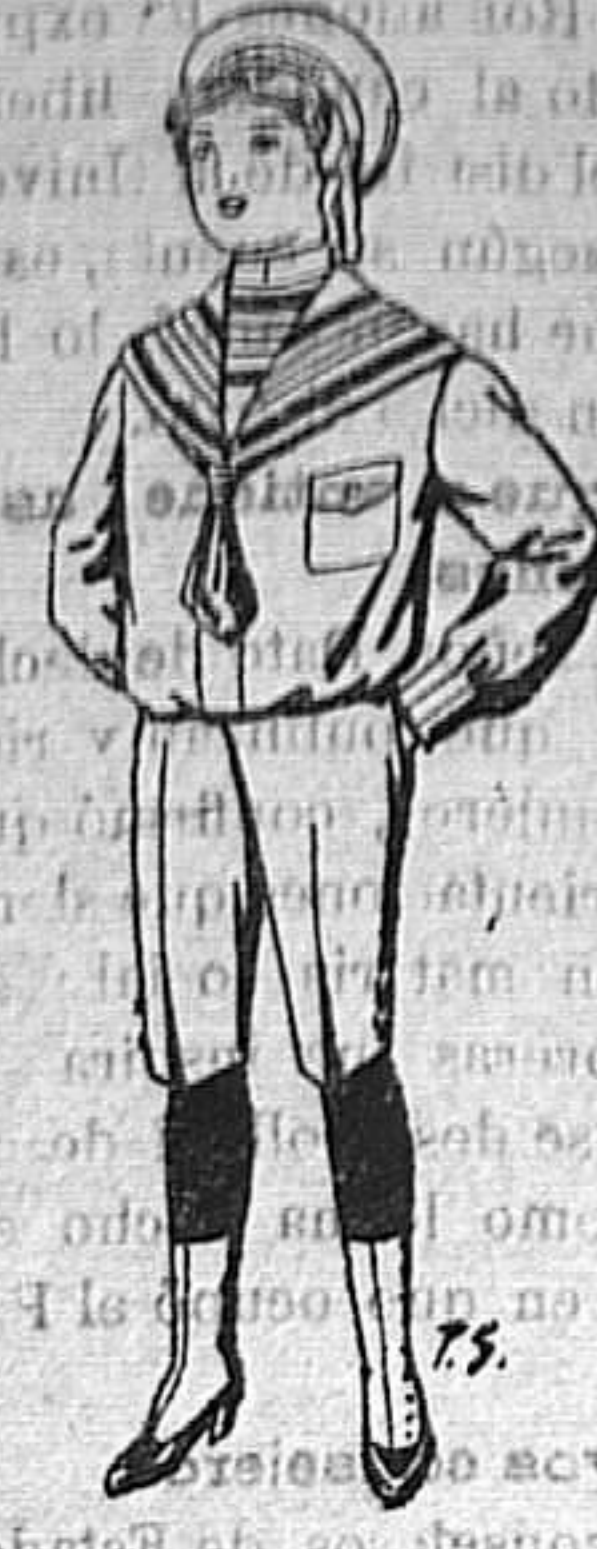
Trajes de perza azul ó en- gral para niños de 4 a 9 años. De ptas. 10 a 26.