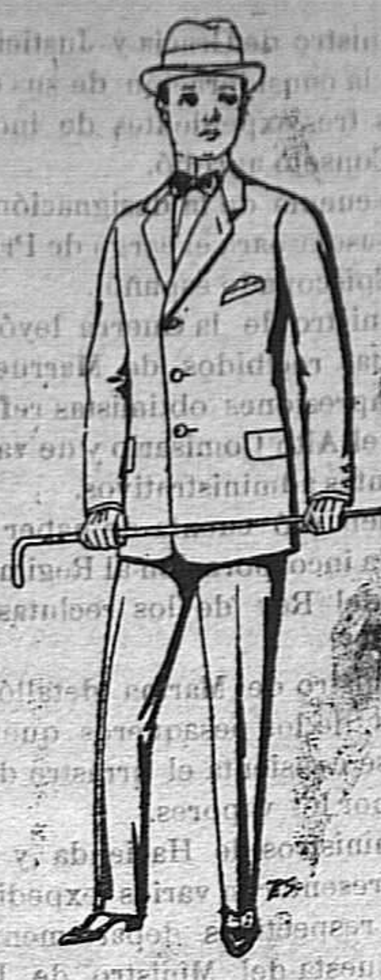
Trajes de paten para juven- cios de 10, a 16 años. De ptas. 14 a 50.