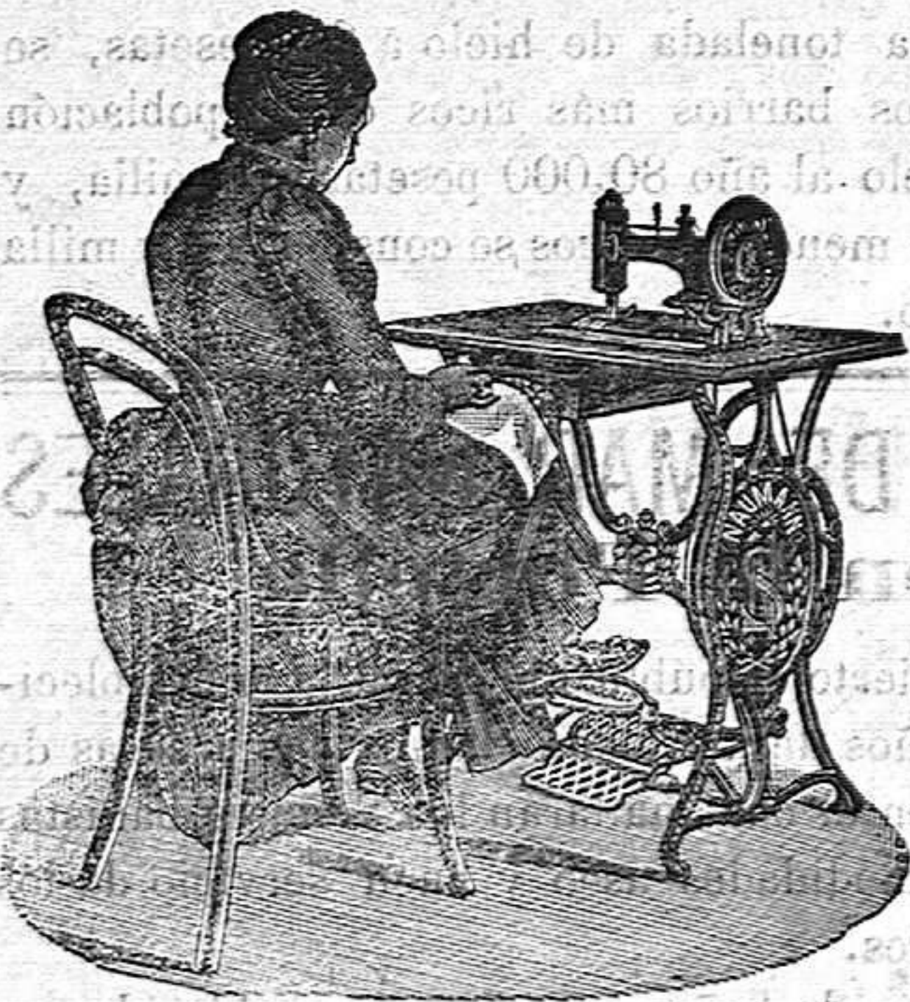
Nuevo, Práctico Higiénico