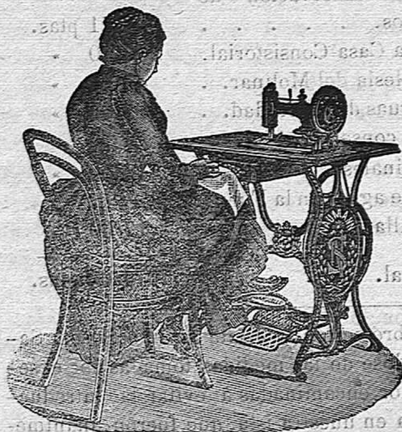
Nuevo, Práctico Higiénico