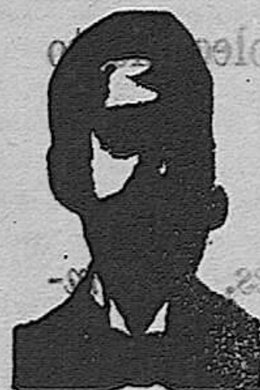
Angelo Costanzi Diputación, 435, etc. Barc.

ó Inyección antivéneza y roob antisifilítico— Costanzi.