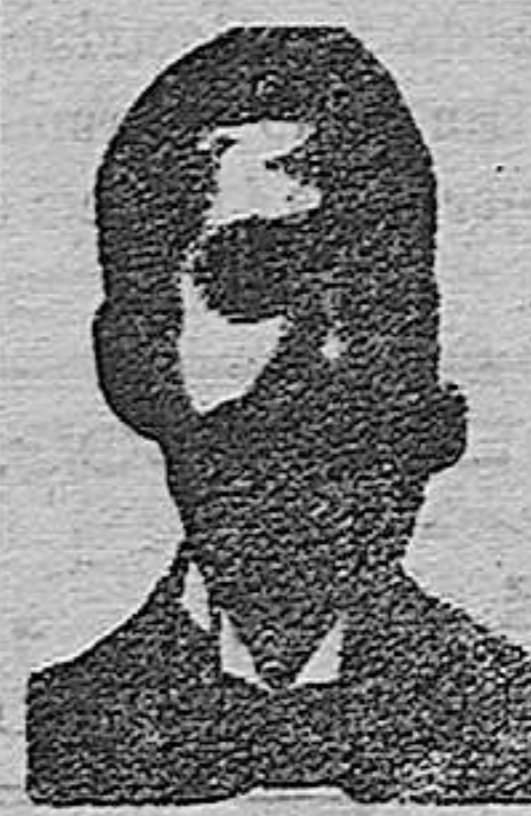
Angelo Costanzi Diputación, 436, et.º Barc.º

Miles y miles de celebridades médicas, después de una larga experiencia, se han convencido y certificado, que para curar radicalmente los estreñimientos uretrales (estrechez), flujo blanco de las mujeres, arenillas, catarros de la vejiga, cálculos, retenciones de orina, escozores uretrales, purgación reciente ó crónica, gota militar y demás infecciones genito-uritarias, no hay medicamento más Milagroso que los Confites ó Inyección Costanzi. También certifican que para curar cualquier enfermedad SIFILITICA, en vista de que el Iodo y el Mercurio son dañinos para la salud, nada mejor que el Roob Costanzi, pues no sólo cura radicalmente la SIFILIS, sino que estriba los malos efectos que producen estas substancias. El inventor, A. Salvati Costanzi, calle Diputación, 435, Barcelona, seguro del buen éxito de estos específicos mediante el trato especial con él, admite á los incrédulos el pago una vez curados. Precio del la Inyección, pesetas 4. Confites antivérea, pesetas 5. Roob antisifilítico, pesetas 4. De venta en todas las buenas farmacias. En Segovia, en la de D. Julio de la Torre Bartolomé, Juan Bravo, 47.