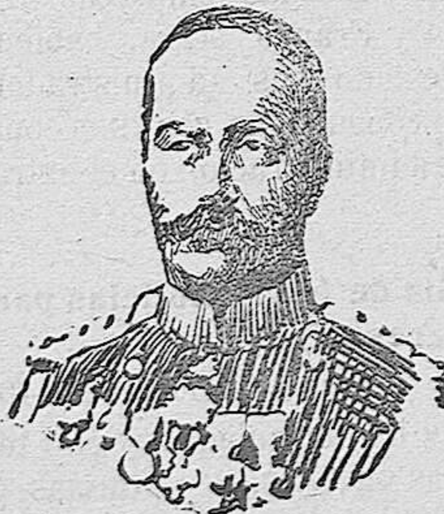
El vizconde Katsura