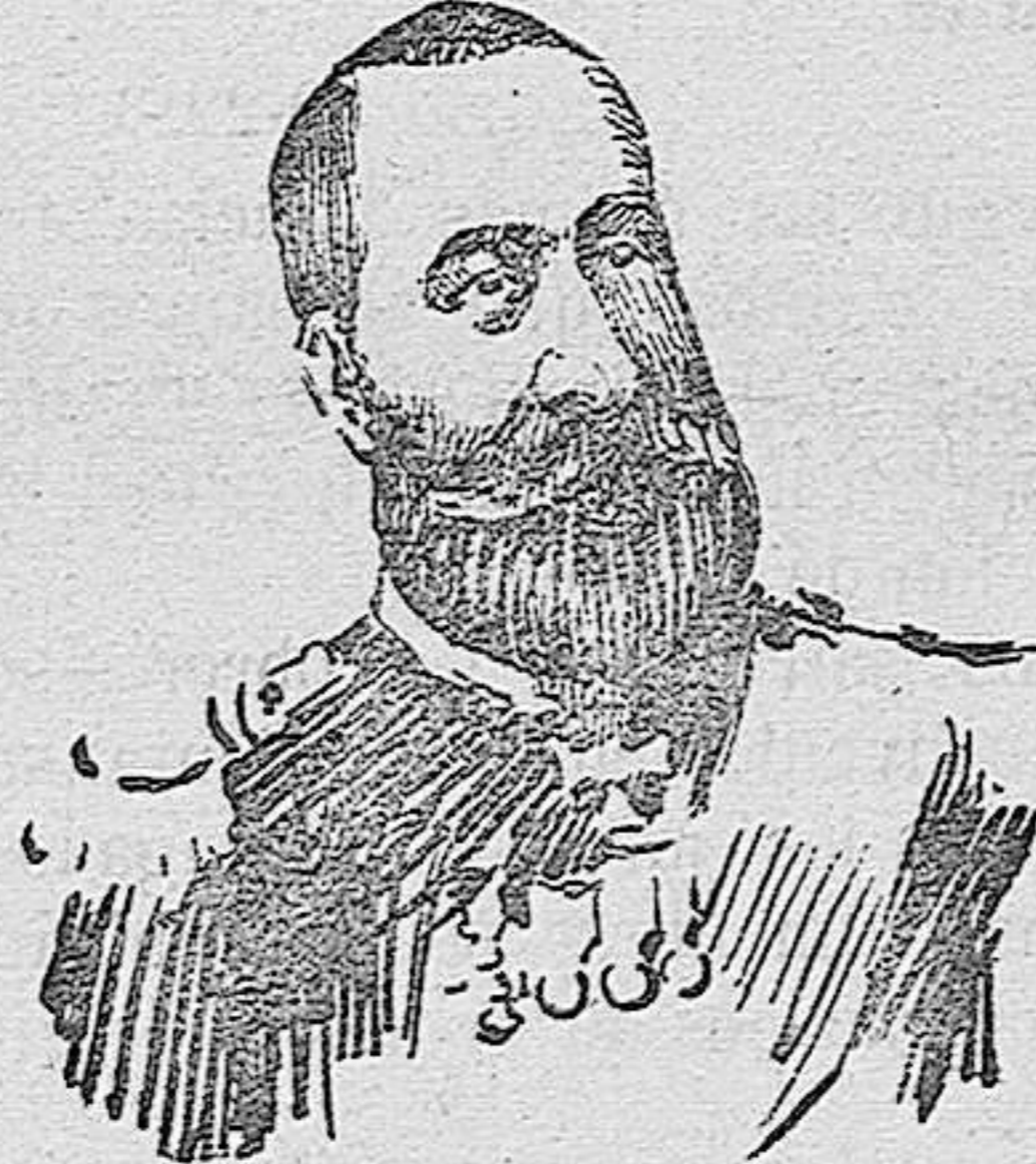
El almirante Alexieff

Comanda la escuadra rusa en el Extremo Oriente.