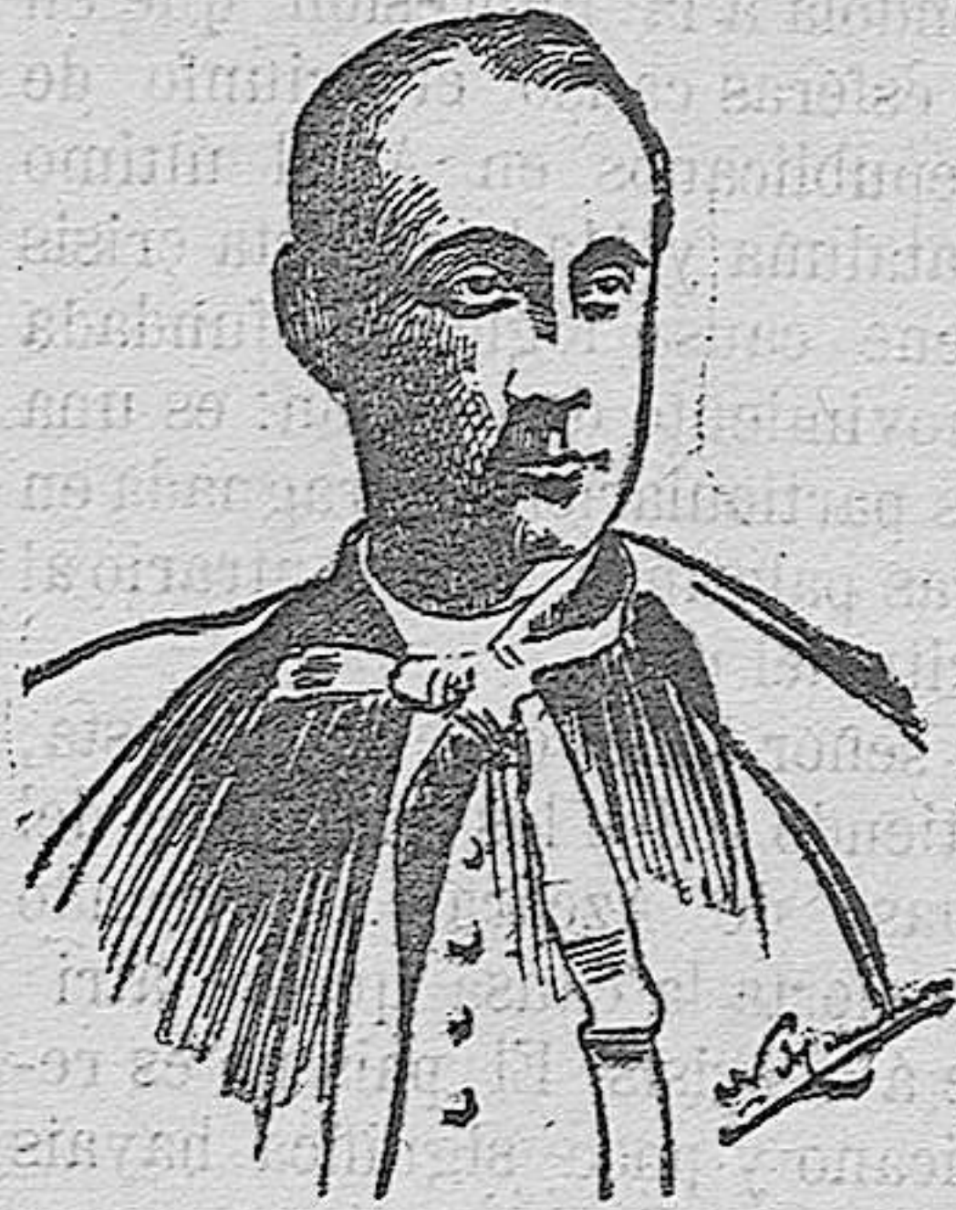
Monseñor Merry del Val