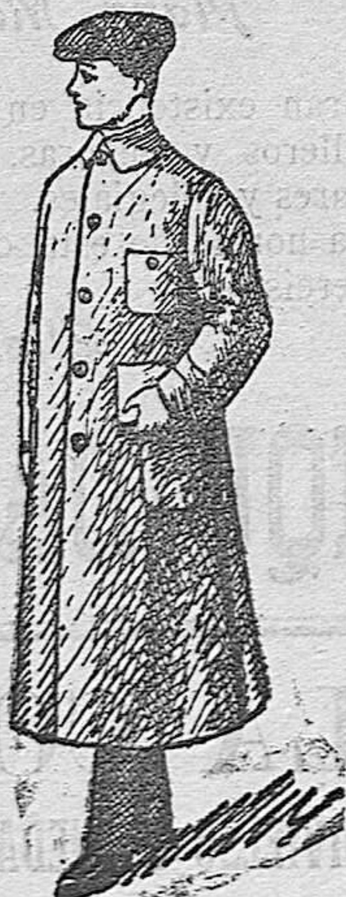
Guarda polvos caballero, a 12, 15, 18, 20, 25 y 30 pesetas