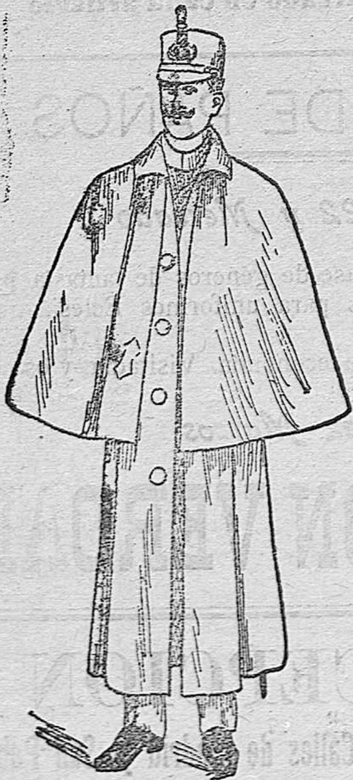
Impermeables en negro y azul con esclavina a 120, 130, 140 y 150 pesetas. Sin esclavina en negro, azul y colores a 50, 70, 80, 90, 100 y 150 pesetas.

Primera casa en confecciones de caballero, señora, jóvenes, niños y niñas