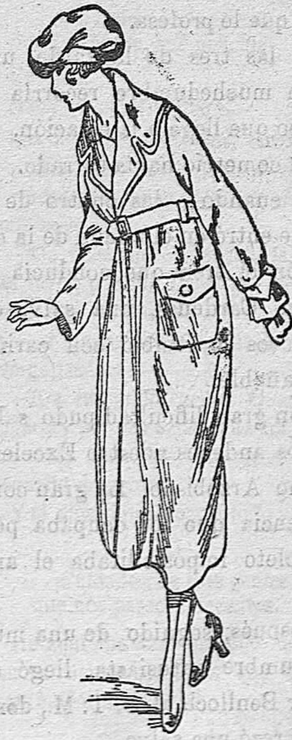
Abrigos paño de señora, a 25, 30, 35, 40 y 50 pesetas. Abrigos de niña desde 15 pesetas a 60.