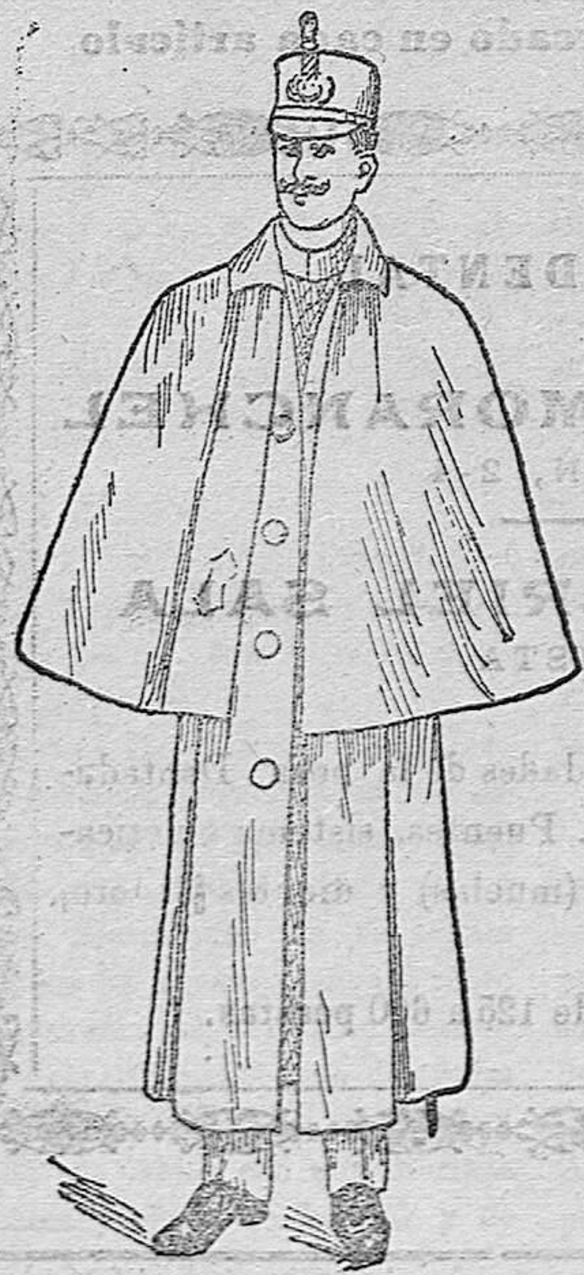
Impermeables en negro y azul con esclavina a 120, 130, 140 y 150 pesetas. Sin esclavina en negro, azul y colores a 50, 70, 80, 90, 100 y 150 pesetas.

Primera casa en confecciones de caballero, señora, jóvenes, niños y niñas