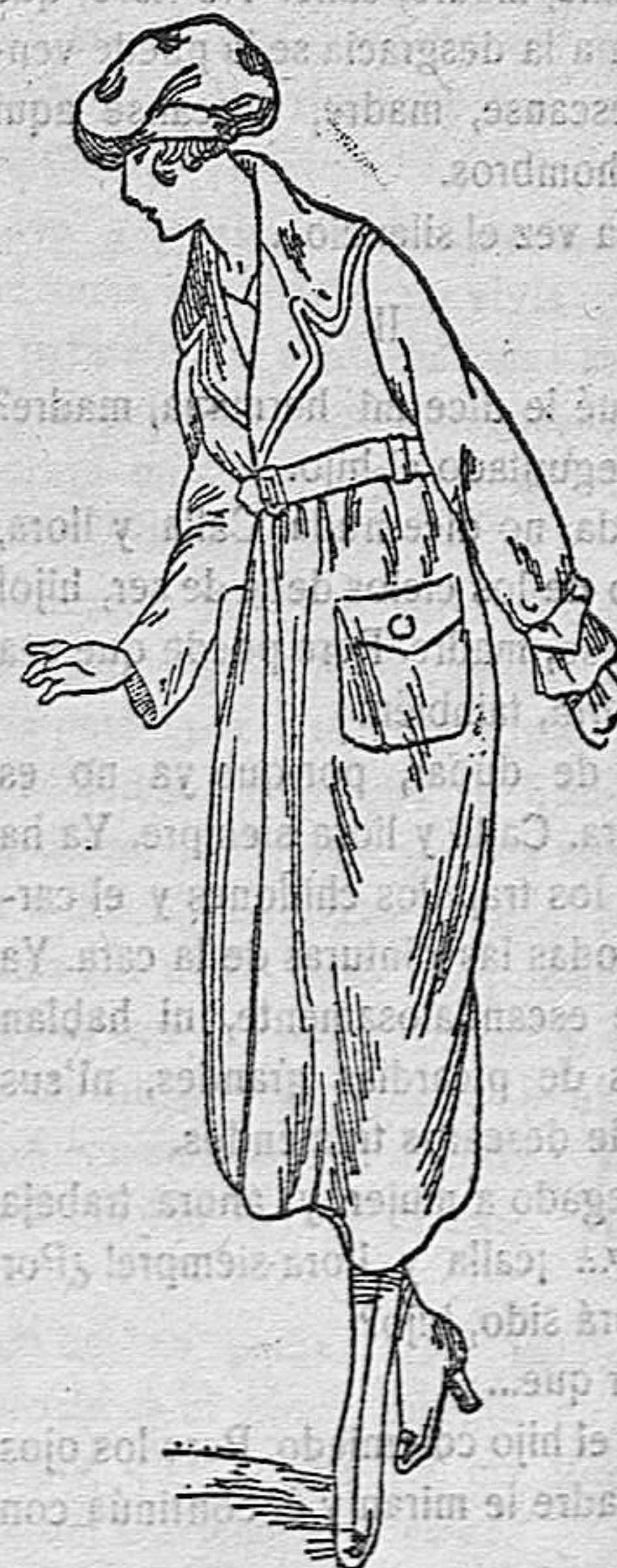
Abrigos paño de señora, a 25, 30, 35, 40 y 50 pesetas. Abrigos de niña desde 15 pesetas a 60.