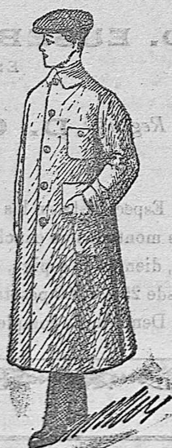
Guarda polvos caballero, a 12, 15, 18, 20, 25 y 30 pesetas