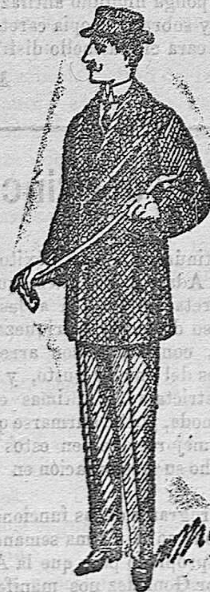
Pelizas de paño castor, rizo en el cuello y mangas, a 20, 25, 30, 40, 50, 60, 70 y 100 pesetas