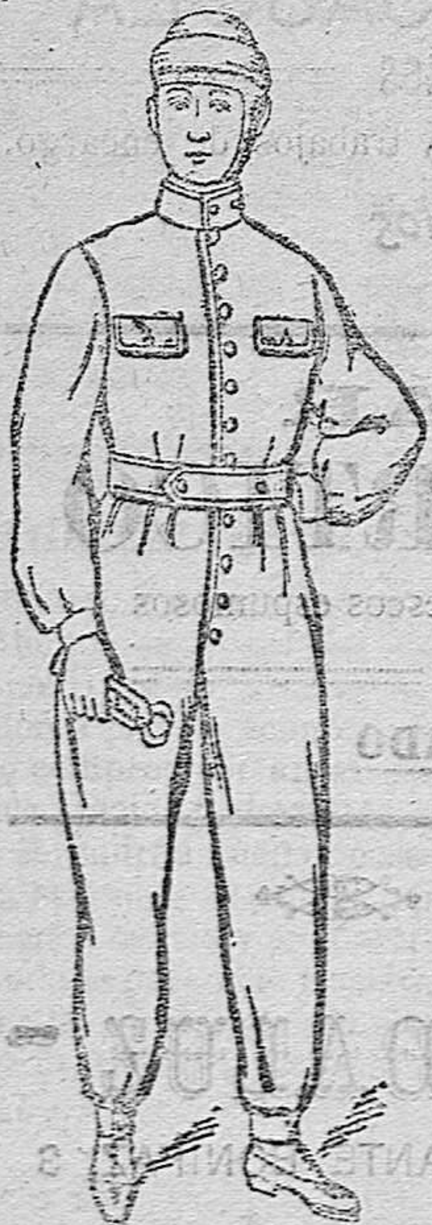
TRAJES COMPLETOS propios para mecánicos y motoristas en azules, a 17 y 25 pesetas y en lona impermeable a 18, 20 y 23 ptas.

Esta casa acaba de recibir nuevas remesas de gabanes de caballero y jóvenes, abrigos de señora y niñas, pellizas, capas, mantas de Palencia y mantones. Gran surtido en impermeables para militar y paisano.