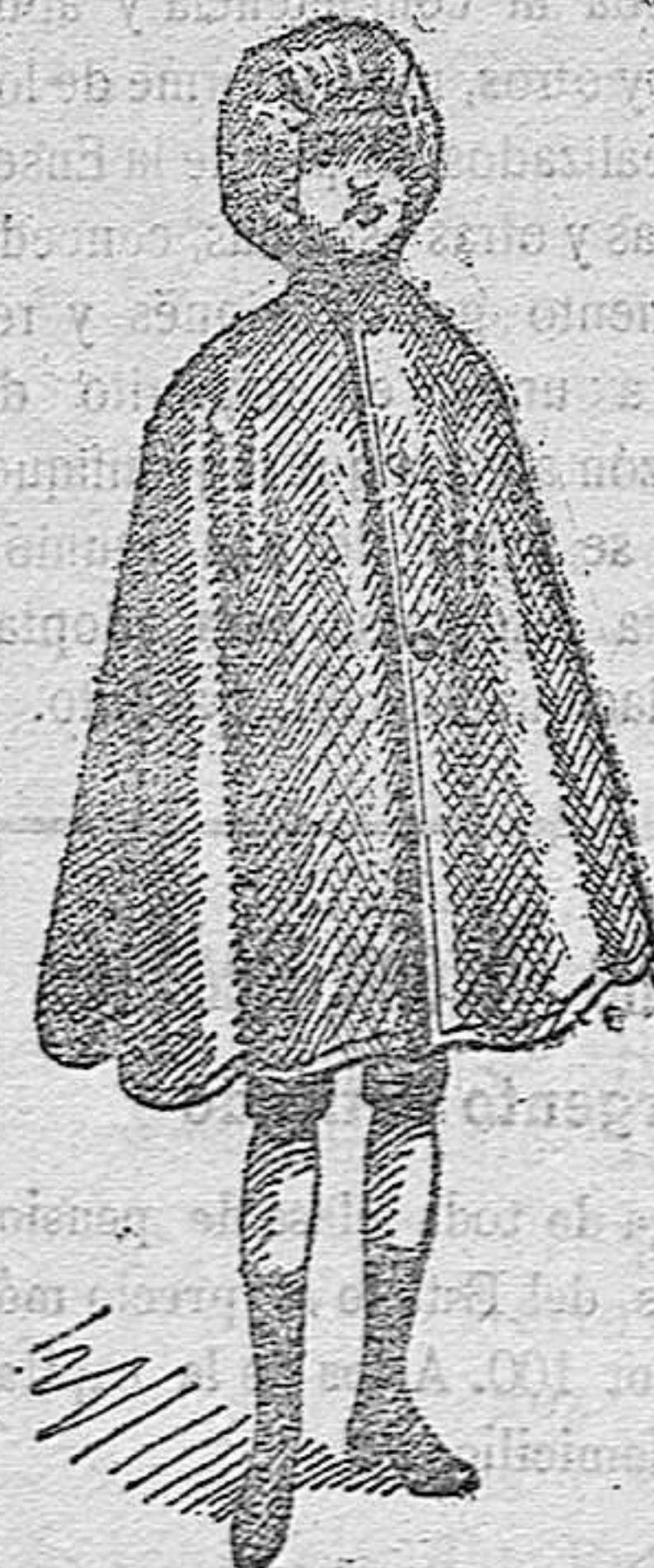
CAPITAS IMPERMEABLES para niños y niñas, a 10, 12, 15, 18 y 20 ptas.