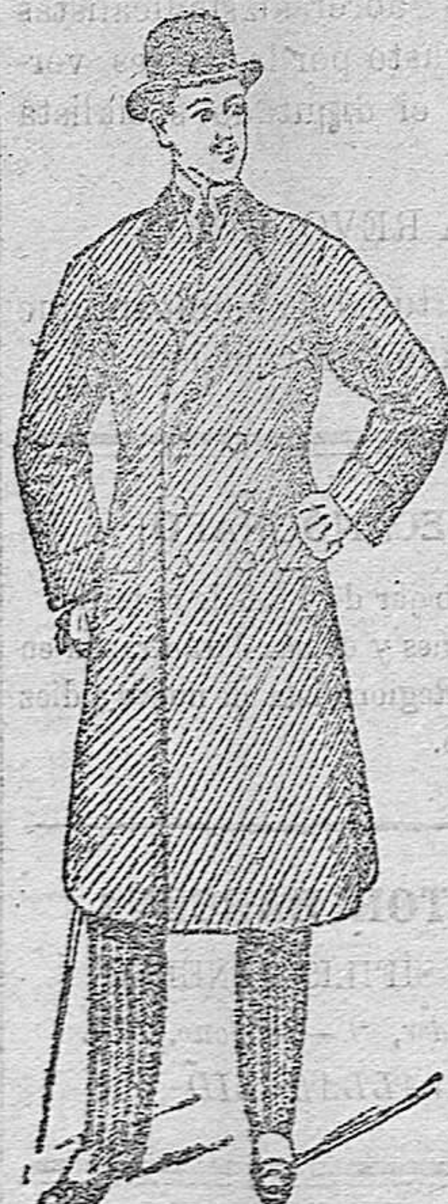
GABANES DE CABALLERO Últimas novedades a 45, 50, 60, 80, 90, 100 y 125 ptas.