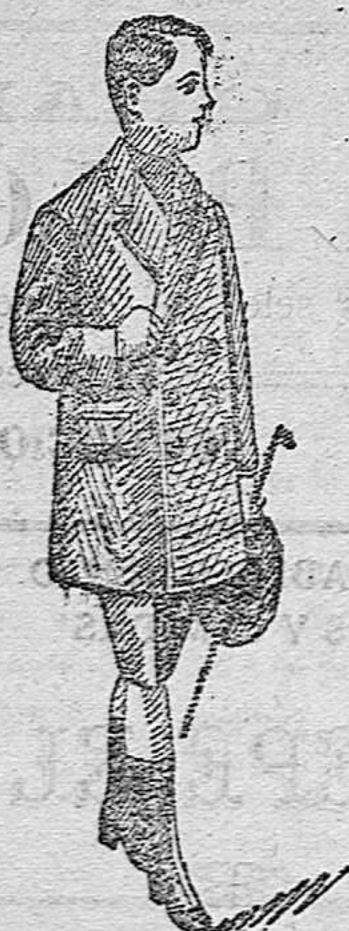
GABANES para niñas y jovencitos desde 20, 25 y 30 ptas.