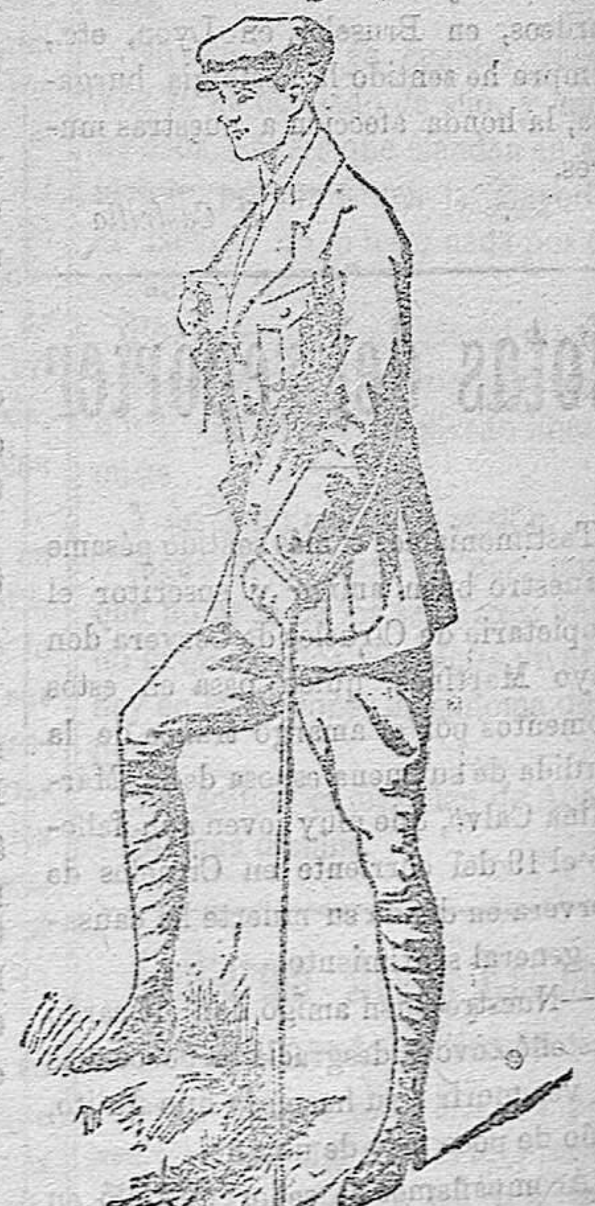
TRAJES COMPLETOS propios para mecánicos y motoristas en azules, a 17 y 22 pesetas y en lona impermeable a 18, 20 y 23 ptas.