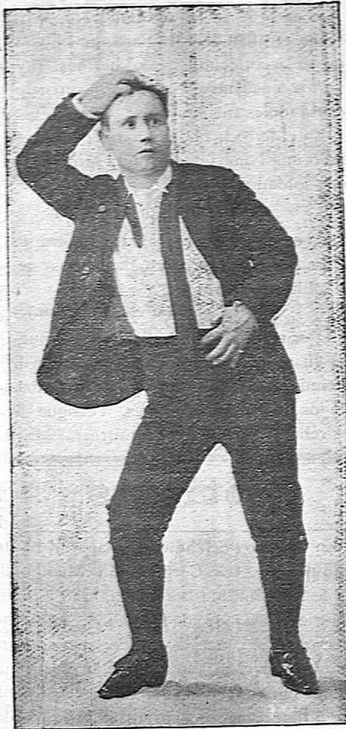
El tenor Simonetti.