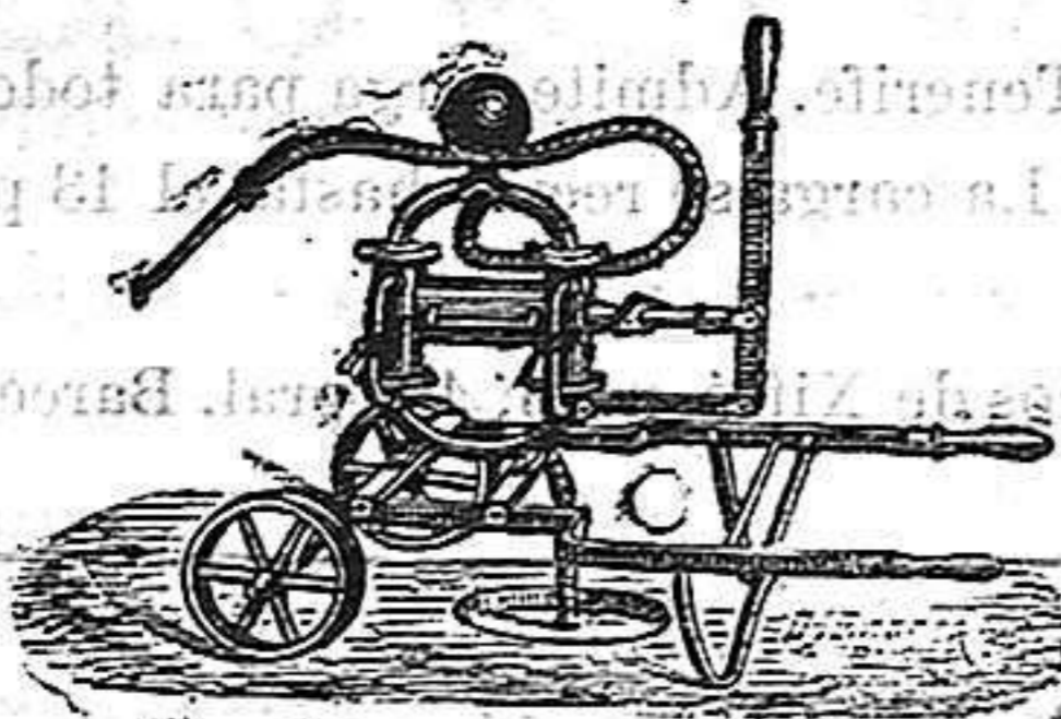
Bomba para riegos.

PELO ó VELLO desaparece en pocos minutos usando el DEPI-LATORIO INGLÉS DE SEGALÁ sin que la salud ni el cutis sufran perjuicio alguno.—Botica de la Corona, Gignás 5, Barcelona.—En Gerona, Peluquería de Pagés, Abeuradors, número 1.