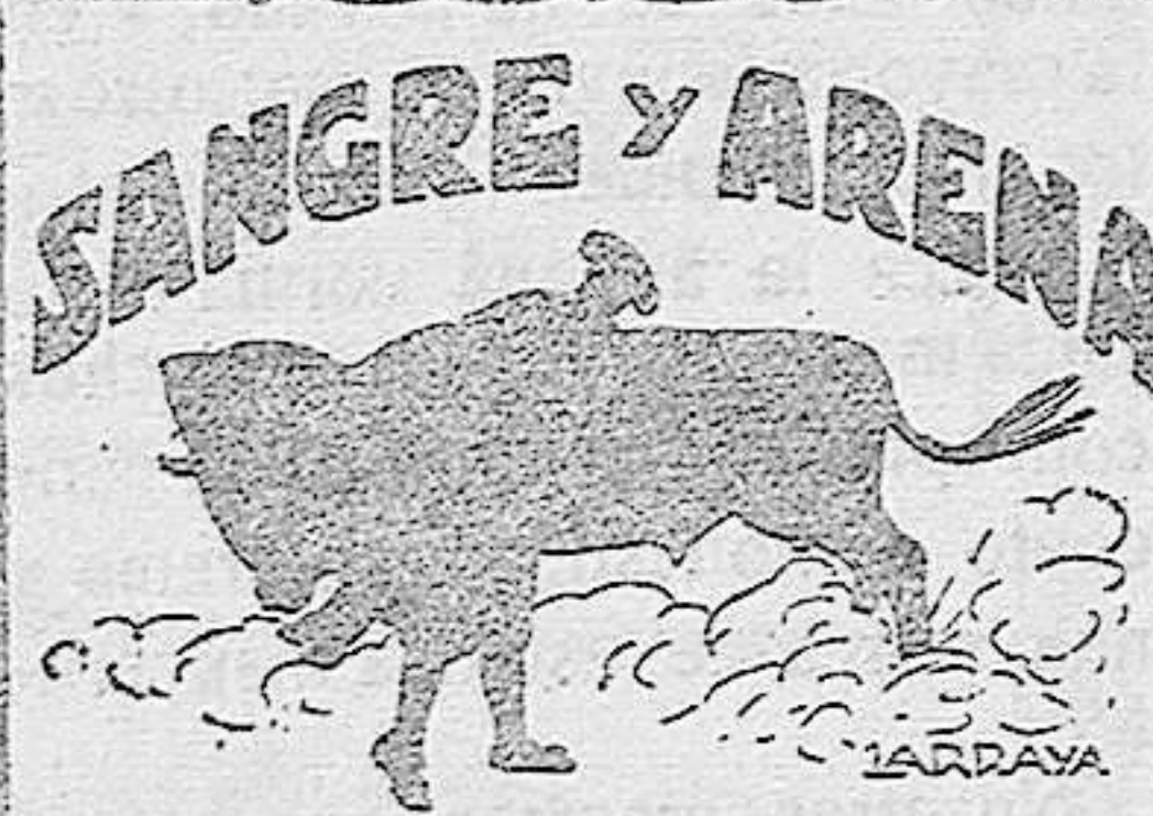
SANGRE Y ARENA